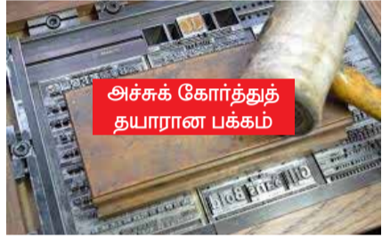
அச்சுக் கோர்த்துத் தயாரான பக்கம்

ஆனால் அச்சு முறை (Press) மாறியிருந்தது. தயாரிக்கப்பட்ட பக்கங்களை கையால் ஒவ்வொன்றாக மைபூசி ஒத்திட்டுப் பதற்குப் பதிலாக, அதனை இயந்திரங்கள் மூலம் 'ஓட்டொமெட்டிக்காக' அச்சிட