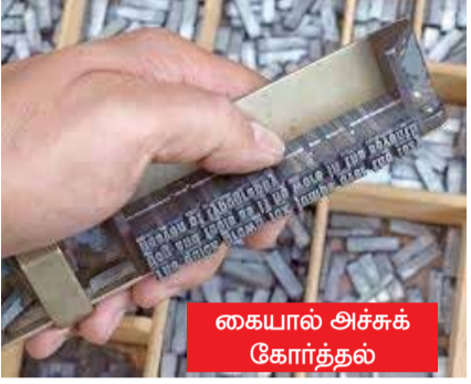
கையால் அச்சுக் கோர்த்தல்

அச்சு ஊடகத்துறையில் இருக்கும் ஓர் ஊடகவியலாளருக்கு அச்சுத்துறை பற்றிய ஓர் அடிப்படை அறிவு இருப்பது