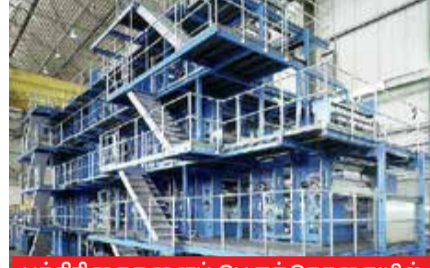
பத்திரிகைகளைப் பெருந்தொகையில் அச்சிடும் நவீன ஓவ் செட் இயந்திரத் தொகுதி