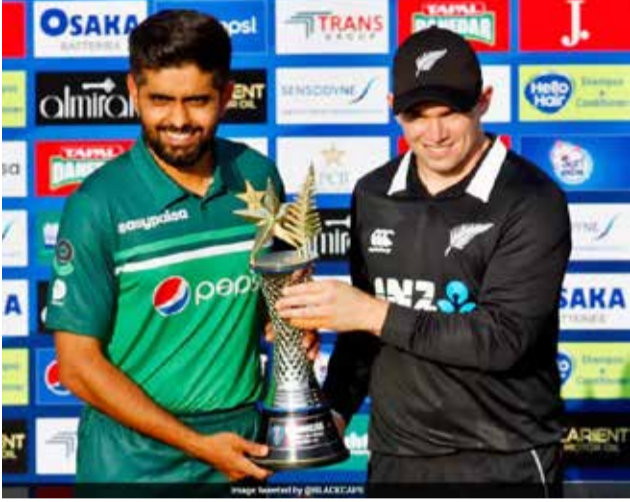
லாகூர், செப். 18

பாகிஸ்தான் அணியுடனான ஒருநாள் மற்றும் இருபது - 20 தொடரை பாதுகாப்பு காரணங்களை காட்டித் திடீரென இடைநிறுத்தியது நியூசிலாந்து கிரிக்கெட் சபை.