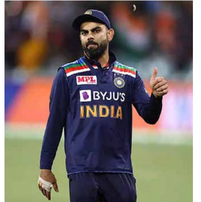
புதுடில்லி, செப். 18

இருபது - 20 உலகக்கிண்ணப் போட்டியின் பின்னர் தலைமைப் பதவியிலிருந்து விலகுகிறேன் என்று விராட் கோலி நேற்று முன்தினம் அறிவித்துள்ளார்.