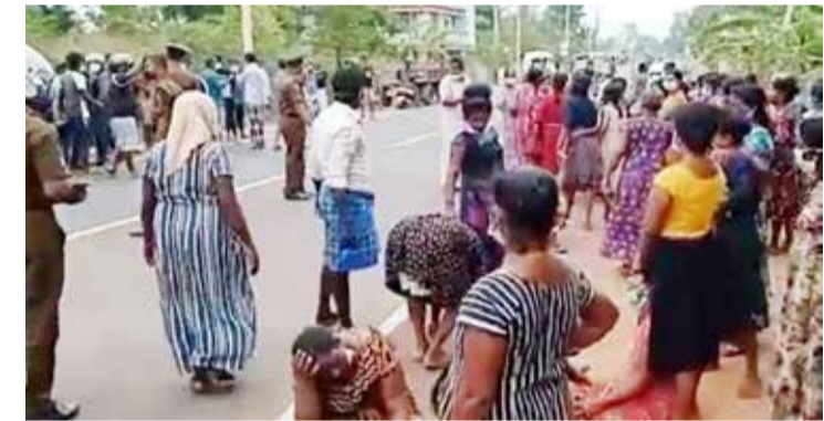
யாழ்ப்பாணத்தில் சடலமாக கண்டெடுக்கப்பட்ட