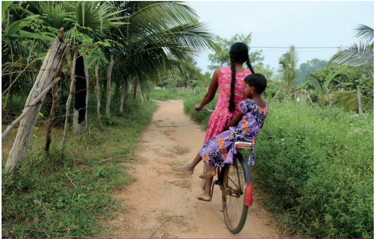
'வாழ்ந்தாலும் ஏசும்; தாழ்ந்தாலும் ஏசும் வையகம் இதுதான்...'

இந்தநிலையில், இயற்கை உணவை நாடியும், இயற்கை விவசாயத்தை நாடியும் மக்கள் பயணப்பட்ட வேண்டிய கட்டாயத்தில் இருக்கின்றார்கள்.