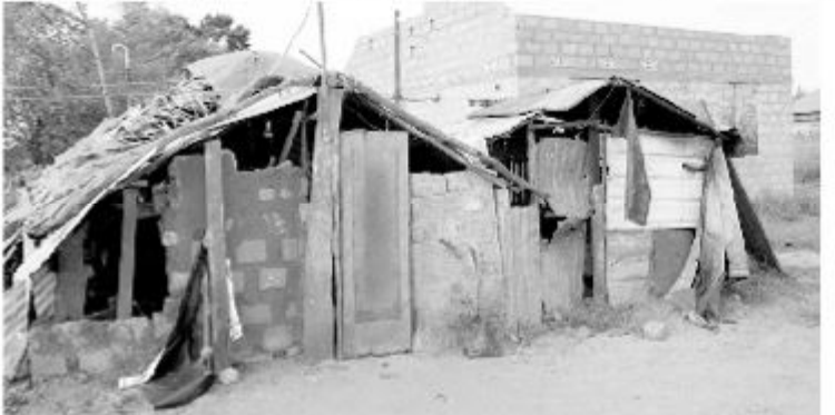
னவுகளாக வழங்கப்பட்டுள்ளன. ஏனைய நிதி கிடைக்கவில்லை எனவும் தெரிவிக்கப்பட்டுள்ளது. (7-4-6-315)