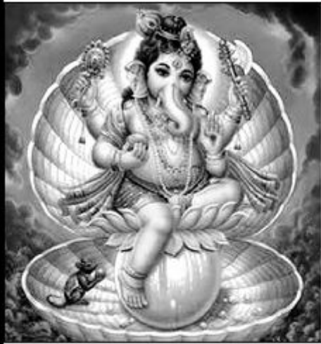
பிறருக்கு உதவுவதில் பிரியம் கொண்ட மேட இராசி வாசகர்களே!

புரட்டாதி மாத கிரக நிலைகளை ஆராய்ந்து பார்க்கும் பொழுது, உங்கள் இராசிநாதன் செவ்வாய் 6 ஆம் இடத்தில் சஞ்சரிக்கின்றார். அவர் புர்வ புண்ணிய ஸ்தானாதிபதி சூரியனுடனும், 6-க்கு அதிபதி புதனுடனும் இணைந்திருக்கின்றார். குருவின் பார்வை உங்கள் இராசிநாதன் மீது பதிந்து, குரு மங்கள யோகத்தை உருவாக்குவதால் மாதம் முழுவதும் நல்ல சம்பவங்கள் நடைபெறப்போகின்றது.