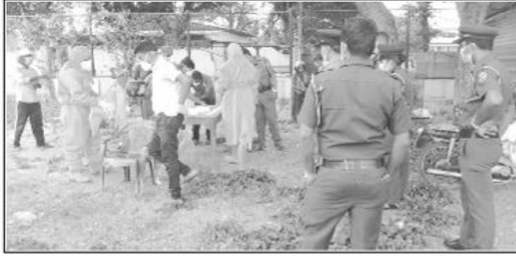
ருக்கு ஜனாதிபதி பணித்திருந்தார்.

நாட்டில் தனிமைப்படுத்தல் ஊரடங்கு வரும் ஒக்டோபர் முதலாம் திகதிவரை நடைமுறைப்படுத்தப்பட்டுள்ள நிலையில் வீதியில் பொதுமக்களின் நடமாட்டம் அதிகரித்துள்ளது. நாட்டில் தனிமைப்படுத்தல் ஊரடங்கை மீறி தேவையற்று நடமாடுபவர்கள் மீது நடவடிக்கை எடுக்குமாறு பொலீஸ்மா அதி