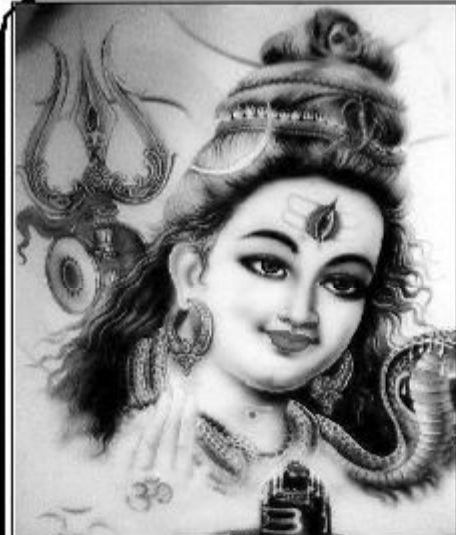
எதையும் முன்விட்டு நடத்தும் திறமைசாலிகளான இடப இராசி வாசகர்களே!

புரட்டாதி மாதக்கிரக நிலைகளை ஆராய்ந்து பார்க்கும் பொழுது, உங்கள் இராசிநாதன் சுக்கிரன் 6 ஆம் இடத்தில் தன் சொந்த வீடானதுலாம் இராசியில் இருக்கின்றார். இராசியிலேயே ராகுவும், சப்தம ஸ்தானத்தில் கேதுவும் சஞ்சரிக்கின்றார்கள். ஜென்மத்தில் ராகு இருப்பதால் பொருளாதாரத்தில் நிறைவு ஏற்படும். சுக்கிர பலமும் நன்றாக இருப்பதால் தொடர் காரியங்களில் வெற்றி கிடைக்கும்.