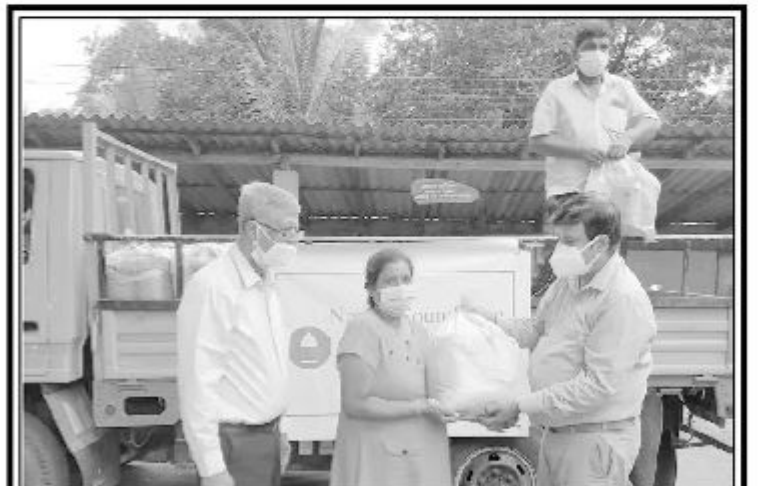
ஏரணடோ கனடா நேயம் பவுண்டேஷன் நிறுவனத்தின் ஊந்து இலட்சம் ரூபாய் நிதியில் உடுவில் மற்றும் தெல்லிப்பளை பிரதேச செயலகப் பிரிவில் நலன்புரி நிலையங்களில் வாழும் 200 குடும்பங்களுக்கு தலா 2000 ரூபாய் பெறுமதியான உலர் உணவுப் பொருட்களும் 500 ரூபாய் பணமும் நேற்று முன்தினம் வழங்கப்பட்டது.

போட்டி முடிவுகள் தினசரிப் பத்திரிகைகள் அல்லை edumin.np.gov.lk எனும் இணையத்தளத்தில் வெளியிடப்படும். வெற்றியீட்டிய குறும்படம் youtube தளத்தில் பதிவேற்றப்படும் மேலதிக விவரங்களுக்கு 071 978 5994 எனும் தொ. இலக்கத்துடன் தொடர்புகொள்ள மாறு ஏற்பாட்டுக்குழு அறிவித்துள்ளது. (4-7)