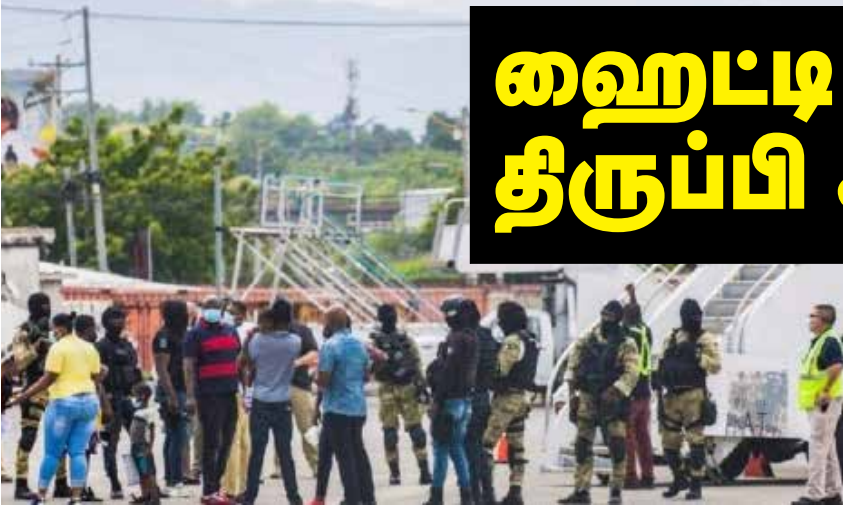
டெக்ஸாஸ் எல்லையில் குவிந்திருந்த ஹைட்ரி நாட்டு அகதிகளை விமானங்கள் மூலம் சொந்த நாட்டுக்குத்