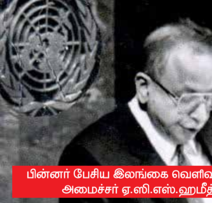
பின்னர் பேசிய இலங்கை வெளிவிவகார அமைச்சர் ஏ.ஸி.எஸ்.ஹமீத்

பாவித்து, அந்த நாட்டின் வெளிவிவகார அமைச்சர் பேசுமுன்பு நாட்டில் தனது இனமக்களின் நிலைபற்றி பேச முயன்றார். சில நிமிடங்களே அவர் பேசினார். ஏனெனில் அவர் அத்துமீறியவர் என