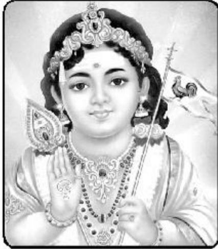
நாட்டுப்பற்று மிக்கவர்களை நண்பர்களாக்கிக் கொள்ளும் மிதுன இராசி வாசகர்களே!

புரட்டாதி மாதக் கிரக நிலைகளை ஆராய்ந்து பார்க்கும் பொழுது, உங்கள் இராசிநாதன் புதன் உச்சம் பெற்றும், வக்கிரம் பெற்றும் சுக ஸ்தானத்தில் சஞ்சரிக்கிறார். குருவின் பரிபுரண பார்வை அதன்மீது பதிவின்றது. உங்கள் இராசி அடிப்படையில் கேந்திராதிபதிய தோஷம் பெற்ற கிரகமான குரு, நீச்சும்பெற்று பார்ப்பது யோகம் தான். பொருளாதாரப் பற்றாக்குறை அகலும். புதிய திருப்பங்கள் பலவற்றையும் சந்திக்கக்கூடும்.