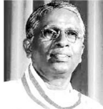
(யாழ்ப்பாணம்) கோப்பாய் ஆசிரியர் கலாசாலையின் முன்னாள் விரிவுரையாளரும் யாழ்ப்பாணம்

நூல் நயப்புரை அரங்கும் வாழ்த்து நிகழ்வும்