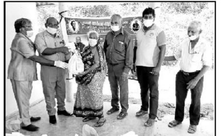
மண்தும்பான் கிராமத்தில் னாமும் கொவிட் நோயினால் பாதிக்கப்பட்ட 70 குடும்பத்திற்கு ஆயிரத்து 340 ரூபாய் பெறுமதியான உலருணவுப் பொருட்கள் கனடாவில் னாமும் குலசேகரம் குடும்பத்தினரின் நிதிப்பங்களிப்பில் பூமணியம்மா அறக்கட்டளையினரால் கடந்த 14 ஆம் திகதி ஷூங்கப்பட்டது.

கைது செய்யப்பட்ட சாரதியையும் கைப்பற்றப்பட்ட கண்டர் வாகனத்தையும் அச்சுவேலி பொலிஸ் நிலையத்தில் பொலிஸ் வீசேட அதிரடிப்படையினர் ஒப்படைத்தனர். (4-7-33)