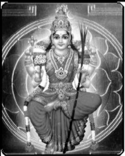
துணைவரும், பண்புடன் கொண்டு செயலாற்றி வெற்றிபெறும் கடக இராசி வாசகர்களே!

புரட்டாதி மாதக் கிரக நிலைகளை ஆராய்ந்து பார்க்கும் பொழுது, மாதத் தொடக்கத்தில் உங்கள் இராசியை குரு பகவான் பார்க்கிறார். அவர் நீச்சம் பெற்று பார்த்தாலும், அவரது பார்வை