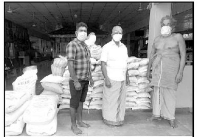
கொற்றாவத்தை உப்புக் கிணற்றுடி அய்யமன் ஆலய நிர்வாகத்தினரின் வேண்டுகோளுக்கமைய தொண்டமானாறு செல்வச்சந்திரன் ஆச்சிரம மோகனதாஸ் சுவாமிகளால் ஆலயச் சூழலில் உள்ள தொழில் பாதிக் கப்பட்ட 125 குடும்பத்தினருக்கு நிவாரணப் பொதிகள் அண்மையில் ஷூங்கப்பட்டன.

நூற்றுக்கணக்கான மாணவர்களையும் மீருதங்க, தபேலா கலைஞர்களையும் உருவாக்கிய பெருமைக்குரிய வராகவும் இவர் விளங்கியுள்ளார். (4-7-18)