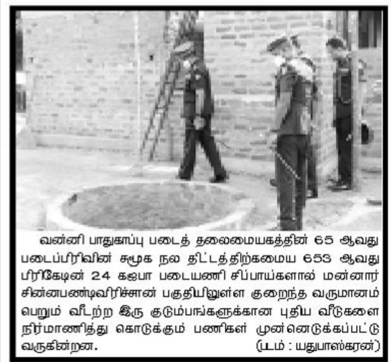
வன்னி பாதுகாப்பு படைத் தலைமையகத்தின் 65 ஆவது படைப்பிரிவின் சமூக நல திட்டத்திற்கமைய 653 ஆவது பிரிகேஷன் 24 கஜா படைபணி சிப்பாய்களால் மன்னார் சின்னப்பண்டிவிரிச்சான் பகுதியிலுள்ள குறைந்த வருமானம் பெறும் வீற்ற இரு குடும்பங்களுக்கான புதிய வீடுகளை நிர்மாணித்து கொடுக்கும் பணிகள் முன்னெடுக்கப்பட்டு வருகின்றன.

முச்சக்கரவண்டியுடன் மோதியதில் குறித்த விபத்து சம்பவம் இடம்பெற்றுள்ளதாக பொலிஸார் தெரிவிக்கின்றனர். சம்பவத்தில் எவருக்கும் எவ்வித பாதிப்புகளும் ஏற்படவில்லை என பொலிஸார் தெரிவிக்கின்றனர். சம்பவம் தொடர்பான விசாரணைகளை பளை பொலிஸார் முன்னெடுத்து வருகின்றனர். (7-4-6-100-316)