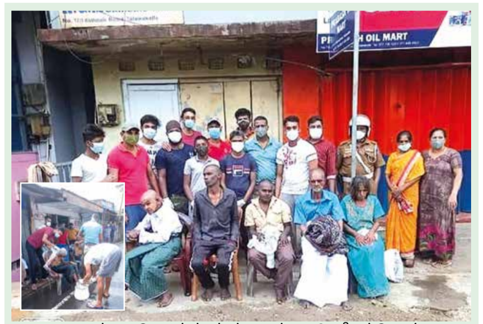
தலவாக்கலை இளைஞர்கள் மற்றும் தலவாக்கலை பொலிஸார் இணைந்து நேற்றுமுன்தினம்(20) தலவாக்கலை நகரிலுள்ள யாசகர்களை குளிப்பாட்டி சுத்தம் செய்யும் பணியை மேற்கொண்டனர். இதன்போது அவர்களின் தலைமுடிக்களை வெட்டி குளிக்கவைத்து புதிய ஆடைகளை அணிவித்து அவர்களுக்கு உணவுகளும் வழங்கப்பட்டன. இதன்போது எடுக்கப்பட்ட படங்கள். (தலவாக்கலை நிருபர்)

(வவுனியா நிருபர்) வவுனியா மாவட்டத்தில் நான்கு கிராம அலுவலர்கள் கொரோனா தொற்றுக்குள்ளாகியுள்ளதாகவும் அவர்கள் தனிமைப்படுத்தப்பட்டுள்ளதாகவும் சுகாதாரப் பிரிவினர் தெரிவித்துள்ளனர். இதுதொடர்பில் மேலும் தெரியவருவதாவது, வவுனியா, செட்டிக்குளம் பிரதேச சுகாதார வைத்திய அதிகாரி பிரிவில், ஆண்டியாபுளியங்குளம் கிராம அலுவலர் மற்றும் விடுமுறையிலிருந்த பெண் கிராம அலுவலர் ஆகிய இருவருக்கும் அன்ரிஜன் பரிசோதனை மேற்கொள்ளப்பட்டுள்ளது. அந்த பரிசோதனையில் அவர்களுக்கு கொரோனா தொற்று உறுதி செய்யப்பட்டுள்ளது. அத்துடன், வவுனியா வடக்கு சுகாதார வைத்திய அதிகாரி பிரிவில் கனகராய்குளம் தெற்கு மற்றும் ஊஞ்சல்கட்டி ஆகிய கிராம சேவகர் பிரிவுகளைச் சேர்ந்த கிராம அலுவலர்களுக்கு அன்ரிஜன் பரிசோதனை மேற்கொள்ளப்பட்டுள்ளது. அந்த பரிசோதனையில் அவர்களுக்கும் தொற்று உறுதிப்படுத்தப்பட்டுள்ளது. இவ்வாறு தொற்று உறுதிப்படுத்தப்பட்ட கிராம சேவகர்கள் நால்வரும் தனிமைப்படுத்தப்பட்டுள்ளதுடன் அவர்களுடன் தொடர்பு பேணியவர்களை தனிமைப்படுத்த சுகாதாரப் பிரிவினர் நடவடிக்கை எடுத்துள்ளனர்.