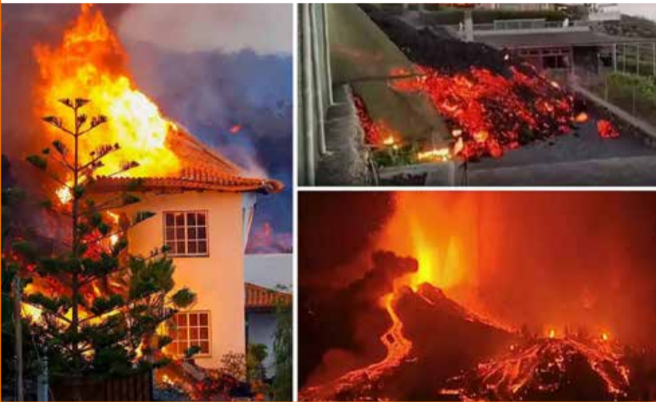
அட்லான்டிக் பெருங்கடலை நோக்கி பெருக்கெடுக்கும் லாவா குழம்பு

ஸ்பெயினில் லா பல்மா எரிமலை வெடித்து சிதறிய நெருப்பு குழம்பு கக்கிவரும் நிலையில், அப்பகுதியிலுள்ள 166 வீடுகள் தீக்கிரையாக்கப்பட்டுள்ளதுடன் அப்பகுதியிலிருந்து சுமார் 6ஆயிரம் பேர் பாதுகாப்பாக வெளியேற்றப்பட்டுள்ளனர்.