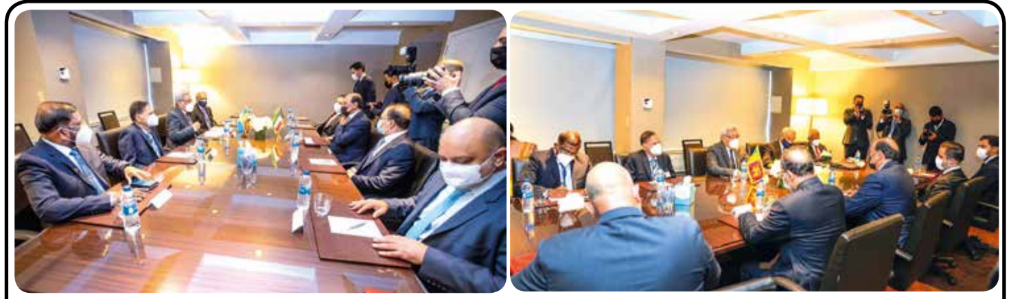
ஜனாதிபதி கோட்டாபய ராஜபக்ஷவுக்கும் குவைட் பிரதமர் ஷெய்க் சபா அல் - ஹமாத் அல் - சபாவுக்கும் இடையிலான சந்திப்பு கடந்த 19ஆம் திகதி நியூயோர்க் மென்ஹாட்டனில் இடம்பெற்றது.

(அநுராதபுரம் நிருபர்) கெக்கிராவ சுகாதார வைத்திய அதிகாரி அலுவலகத்துக்குட்பட்ட ஆறு மதுபான விற்பனை நிலையங்களுக்கு சுகாதார தரப்பினரால் சீல் வைக்கப்பட்டுள்ளதாக கெக்கிராவ பொலிஸார் தெரிவித்தனர். இது தொடர்பில் மேலும் தெரியவருவதாவது, கெக்கிராவ நகரிலுள்ள நான்கு மதுபான விற்பனை நிலையங்களுக்கும் மடாடுகம மற்றும் மரதன்கடவள நகரிலுள்ள இரு மதுபான விற்பனை நிலையங்களுக்கும் இவ்வாறு சீல் வைக்கப்பட்டுள்ளது. பொதுமக்கள் ஒன்றுகூடுவதை தடுக்கும் நோக்கில் தனிமைப்படுத்தும் சட்டத்தின் பிரகாரம் தமக்கு வழங்கப்பட்டுள்ள அதிகாரத்தினை பயன்படுத்தி சுகாதார தரப்பினர் மேற்படி மதுபானசாலைகளுக்கு சீல் வைத்துள்ளதாக கெக்கிராவ பொலிஸார் மேலும் தெரிவித்தனர்.