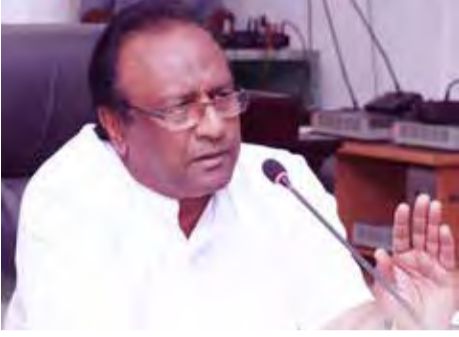
கொழும்பு, செப். 23

“2018 ஆம் ஆண்டு காலப்பகுதியில் முன்னெடுக்கப்பட்டதாகத் தெரிவிக்கப்பட்ட அப்போதைய ஜனாதிபதி மைத்திரிபால சிறிசேன மற்றும் முன்னாள் பாதுகாப்புச் செயலாளர் கோட்டாபய ராஜபக்ஷ ஆகியோர் மீதான கொலைச் சூழ்ச்சியில் அரசியல்வாதிகளோ, அரசியல் கட்சிகளோ தொடர்புபட்டிருக்கவில்லை.”