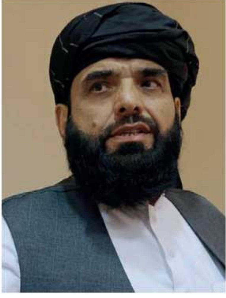
தலிபான்கள் வசமாகிய பின்னர், 70க்கும் மேற்பட்டோர் கொண்ட இடைக்கால அரசை தலிபான்கள் அறிவித்தனர்.

கடந்த ஓகஸ்ட் 15 ஆம் திகதி ஆப்கானிஸ்தான் முழுமையாக