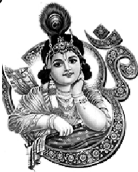
அமைதியாக இருந்தே அரிய பணிகள் பலவற்றை செய்யும் மகர இராசி வாசகர்களே!

இம்மாதம் பணப்புழக்கம் அதிகரிக்கும். நினைத்ததை நினைத்த நேரத்தில் செய்து முடிப்பீர்கள். கணவன் - மனைவிக்குள் பாசமும், நேசமும் அதிகரிக்கும். வேலையில்லாப் பட்டதாரிகளாக விளங்கிய பிள்ளைகளுக்கு இப்பொழுது தகுதிக்கேற்ப வேலை கிடைக்கும். விலை உயர்ந்த பொருட்களை வாங்கி மகிழ்வீர்கள். வாகன மாற்றம் செய்ய உகந்த நேரம் இது. பண்புரிபும் பெண்களுக்கு சம்பள உயர்வும், சலுகைகளும் கிடைக்கப்பெறும்.