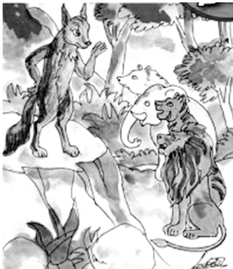
ஒடிவந்த நரிகள் "அன்பர்களே... மன்னராக இருப்பது, நரி தான். நீங்கள் நினைப்பதுபோல,

தேவலோக விலங்குகளும், உடலில் நீலச்சாயம் பூசி, வேஷம் போட்டு முட்டாளாக்கியுள்ளது" எனக் கூறின. விலங்குகள் திரண்டு, நீலநரியை நோக்கிப் பார்த்தன. உயிர் பிழைக்க, விழுந்தடித்து ஓடியது.