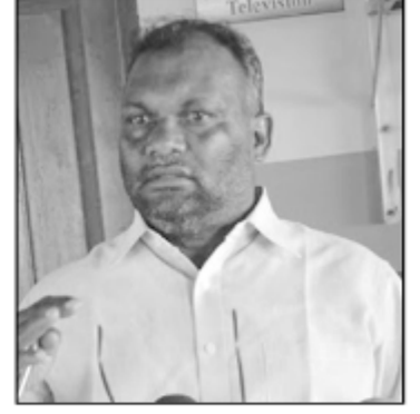
என்று அவர் மேலும் தெரிவித்தார். (நி-4)

எம் அரசியல் முனைப்புக்களையும் கபளிகரம் செய்து மீண்டும் பேரினவாதிகளின் கால்களில் மண்டியிடவைக்கும் என்பது மட்டும் திண்ணம்