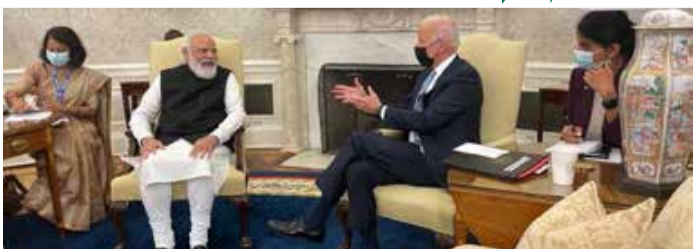
அமெரிக்காவில் வெள்ளை மாளிகைக்குச் சென்ற இந்தியப் பிரதமர் நரேந்திர மோடி, அந்நாட்டு ஜனாதிபதி