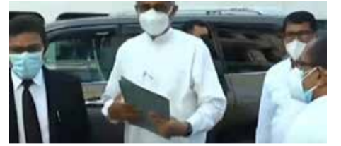
படும் நிதி மோசடி குறித்தே, அவரிடம் வாக்குமூலம் பெறப்பட்டதாக அங்கிருந்து கிடைக்கும் தகவல்கள் தெரிவிக்கின்றன.

குற்றப்புலனாய்வு திணைக்களத்தில் நேற்று (வெள்ளிக்கிழமை) காலை முன்னிலையாகிய, நாடாளுமன்ற உறுப்பினர் பாட்டாலி சம்பிக்க ரணவக்க தற்போது அங்கிருந்து வெளியேறியுள்ளார். அவரிடம் 3 மணி நேரம் வாக்குமூலம் பதிவு செய்யப்பட்டுள்ளதாகக் கூறப்படுகின்றது. கடந்த ஆட்சியில் அமைச்சராக பணியாற்றிய காலப்பகுதியில் இடம்பெற்றதாகக் கூறப்படும் நிதி மோசடி குறித்தே, அவரிடம் வாக்குமூலம் பெறப்பட்டதாக அங்கிருந்து கிடைக்கும் தகவல்கள் தெரிவிக்கின்றன.