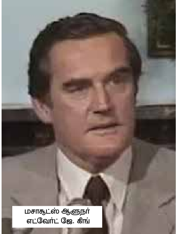
மசாகூட்ஸ் ஆளுநர் எட்வோர்ட் ஜே. கிங்

அந்தச் சபை நிறைவேற்றியது. மசாகூட்ஸ் சட்டசபை இந்தத் தீர்மானத்தால் அமெரிக்க ஜனாதிபதியையும், அமெரிக்க காங்கிரஸையும் தங்களுக்கு இருக்கும் கணிசமான செல்வாக்கைப் பாவித்து கடுமையான அநீதிகளுக்கும் மனிதாபிமானத்திற்கு எதிராகவும், ஸ்ரீலங்காவின் தமிழ் மக்கள் நடத்தப்படுவதிலிருந்து அவர்களைப் பாதுகாக்க வேண்டும்" - என்று தீர்மானம் கூறியது. அதனை நிறைவேற்றிய சட்டசபை அந்தத் தீர்மானத்தை அமெரிக்க ஜனாதிபதிக்கும், அதன் காங்கிரஸ் அங்கத்தினர்களுக்கும் மேலும் கொமன்வெல்த் (பொது நலவாய்) தேசங்கள் அமைப்பின் காரியதரிசி, ஐ.நா. சபையின் காரியதரிசி ஆகியோர்களுக்கும் அனுப்பி வைத்தது. அது மட்டுமல்ல, அந்தத் தீர்மானம் நிறைவேற்றப்பட்டதின் பின் அந்த மாநிலத்தின், கவர்னர் எட்வார்ட் கிங் (Edward King) 22 மே 1979 தினத்தைத் தமிழீழ நாளாகப் பிரகடனம் செய்து, தமிழர் விடுதலைக் கூட்டணியில் நல்லூர்த் தொகுதி நாடாளுமன்ற உறுப்பினர் சிவசிதம்பரத்தை அந்த மாநிலத்தின் நிகழ்வுகளில் பங்குபற்ற அழைத்து, நிறைவேற்றப்