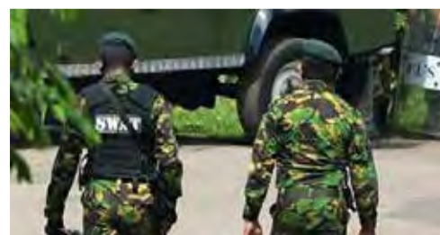
புதிதாக நிர்மாணிக்கப்பட்டு வரும் வீடொன்று சோதனைக்கு உட்படுத்தப்பட்டது. குறித்த வீட்டில் மறைத்து வைக்கப்பட்டிருந்த ஒரு கிலோ கிராம் 55 கிராம் ஹெரோயின், 50 கிராம் ஐஸ் போதைப்பொருள், வெளிநாட்டில் உற்பத்தி செய்யப்படும் துப்பாக்கி,

கருத்துறை, செப். 29 கருத்துறை மாவட்டத்தின் மத்துகம பொலிஸ் பிரிவுக்குட்பட்ட யட்டதொலவத்த பிரதேசத்தில், புதிதாக நிர்மாணிக்கப்பட்டு வரும் வீடொன்றிலிருந்து போதைப்பொருட்கள், துப்பாக்கி என்பவை கைப்பற்றப்பட்டுள்ளன என்று பொலிஸ் தலைமையகம் நேற்று விடுத்துள்ள செய்தி அறிக்கையில் தெரிவிக்கப்பட்டுள்ளது. பொலிஸ் விசேட அதிரடிப் படையின் தலைமையகத் துக்குக் கிடைக்கப்பெற்ற தகவலுக்கு அமைவாக மத்துகம பொலிஸ் பிரிவுக்குட்பட்ட யட்டதொலவத்த பிரதேசத்தில்