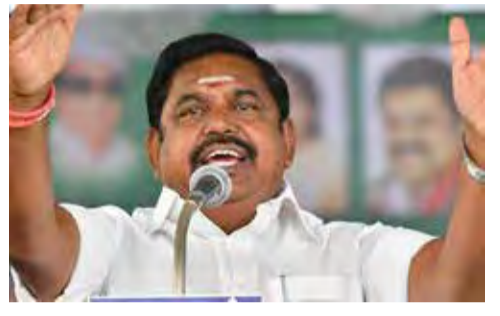
பதில் சொல்லியே ஆக வேண்டும் எனவும் எச்சரிக்கை விடுத்தார். மேலும், தி.மு.க. தேர்தலின் போது அறிவித்த அறிவிப்புகளில் சிலவற்றை தங்கள் ஆட்சியில் கொண்டுவந்த திட்டங்களின் மட்டுமே பெயர் மாற்றி நிறைவேற்றி விட்டு பொய் பரப்புரைகளையும், விளம்பரங்களையும் செய்து வருகின்றனர் எனவும் குற்றம் சாட்டினார்.

துள்ளதாகவும், எந்த அச்சுறுத்தலுக்கும் அ.தி.மு.க. பயன்படாது எனவும், அ.தி.மு.க. ஆட்சியின் போது எடப்பாடி பழனிசாமியின் தொகுதியில் உள்ளாட்சி தொகுதிகளில் குறைந்த வாக்குகள் வித்தியாசத்தில் ஜெயித்த தி.மு.க வினாருக்கு ஜனநாயக முறைப்படி நாங்கள் விட்டுக் கொடுத்தோம் எனவும் தெரிவித்தார். தொடர்ந்து பேசிய எடப்பாடி, நாங்கள் நீதிமன்றத்தில் வழக்கு தொடர்ந்துள்ளோம் எனவும் . தங்கள் கட்சி வேட்பாளர்களின் மனுக்கள் நிராகரிப்பிற்கு காரணமான அதிகாரிகள் இதற்கு நிச்சயம்