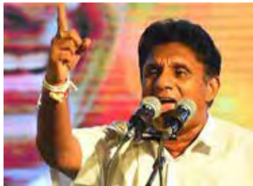
காலத்தில் தேர்தலை அரசு நடத்த வேண்டும். தேர்தலை நடத்தினால்தான் அரசு தொடர்பாக மக்களின் நிலைப்பாட்டை அறிந்து கொள்ள முடியுமாக இருக்கும்" - என்றார். (இ)

அம்பாறை பிரதேசத்தில் நேற்றுமுன்தினம் நடைபெற்ற நிகழ்வொன்றின்போது, ஊடகங்களுக்குக் கருத்துத் தெரிவிக்கையிலேயே எதிர்க்கட்சித் தலைவர் மேற்கண்டவாறு கூறினார். இதன்போது அவர் மேலும் தெரிவித்ததாவது: - "இந்த நேரத்தில் தேர்தலை நடத்தினால் மக்களின் வேதனைகளைப் புரிந்துகொள்ள முடியும். எனவே, சர்வதேசத்துக்குச் சென்று தேர்தல் தொடர்பில் பொய்களைக் கூறாது, உரிய