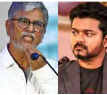
அப்பா, அம்மா மற்றும் சிலர் மீது சென்னை உரிமையியல் நீதிமன்றத்தில் வழக்கும் தொடர்ந்தார் விஜய். தனது பெயரை பயன்படுத்தி பொதுக் கூட்டங்களை நடத்த தனது தந்தையான எஸ்.ஏ.சந்திரசேகர், தாய் ஷோபா சந்திரசேகர் உள்பட விஜய் மக்கள் இயக்கத்தினருக்குத் தடை விதிக்கவும் அந்த மனுவில் கோரியிருந்தார் விஜய். விஜயின் மனுவிற்கு பதில் அளிக்கும்படி சம்பந்தப்

சென்னை, செப். 29 விஜய் மக்கள் இயக்கம் கலைக்கப்பட்டுவிட்டதாக நடிகர் விஜயின் தந்தையும் இயக்குநருமான எஸ்.ஏ.சந்திரசேகர் சென்னை உரிமையியல் நீதிமன்றத்தில் தெரிவித்துள்ளார். விஜய் மக்கள் இயக்கம் என்ற பெயரில் ஒரு கட்சியைத் தான் ஆரம்பித்துள்ளதாக சென்ற ஆண்டு திடீரென்று எஸ்.ஏ.சந்திரசேகர் அறிவித்தார். இதனை தேர்தல் ஆணைக்குழுவினும் பதிவு செய்ய விண்ணப்பித்திருந்தார். உடனேயே இந்த மக்கள் இயக்கத்திற்கும் தனக்கும் எந்தத் தொடர்பும் இல்லை யென்றும், இந்த அமைப்பில் தனது ரசிகர்கள் யாரும் சேரக்கூடாது என்றும் அறிக்கை வெளியிட்டார் நடிகர் விஜய். கூடவே இந்த இயக்கத்தில் நிர்வாகிகளாக இருந்த தனது