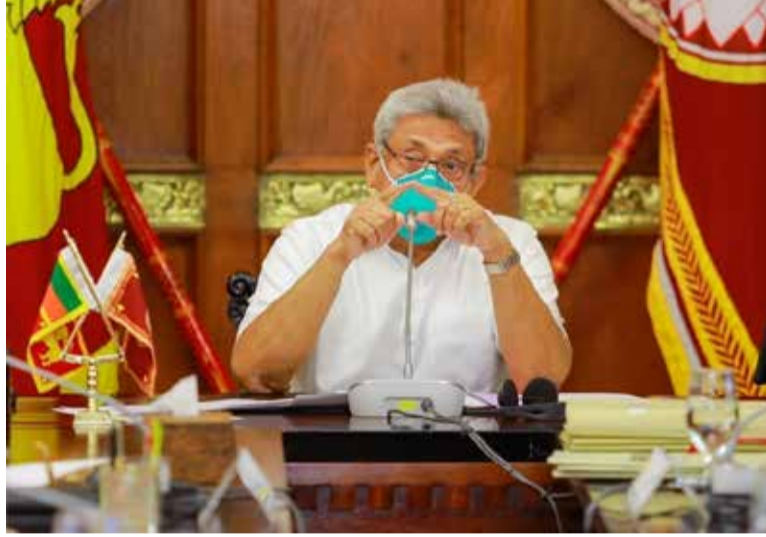
பெறவுள்ளன. அரசு சேவையாளர்களுக்கு காண விசேட சுற்றறிக்கையை பொது நிர்வாக அமைச்சு இன்று வெளியிடவுள்ளது. நாடு திறக்கப்பட்டாலும் பொது நிகழ்வுகள் மற்றும்

இதன்படி அரசு அலுவலர்கள் கடமைகளுக்கு சமூகமளிக்கும் நேரம் காலை 9 மணியாகவும், தனியார்துறை ஊழியர்கள் சமூகமளிக்கும் நேரம் காலை 10 மணியாகவும் மாற்றுவதற்கு அரசு உத்தேசித்துள்ளது. அதற்கமைய போக்குவரத்துச் செயல்பாடுகள் இடம்