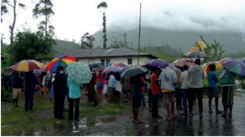
அதிகாரிக்கும் தொழிலாளர்களுக்கும் இடையில் வாக்குவாதமும் முறுகல் நிலையும் தோன்றியதாக தெரிவிக்கப்பட்டுள்ளது.

மஸ்கெலியா - மசைட்டில் நிரவாகத்திற்கு எதிராக அத்தோட்டத்தை சேர்ந்த சுமார் 300க்கும் மேற்பட்ட தொழிலாளர்கள், கடந்த 8 நாட்களாக பணிப்பகிஷ்கரிப்பை முன்னெடுத்து வருவதுடன், நேற்று (28) தொழிற்சாலைக்கு முன்பாக ஆர்ப்பாட்டத்தில் குதித்தனர். மஸ்கெலியா மசைட்டில் நிரவாகம், தேயிலை மலைகளை காடுகளாக்கி சுத்தம் செய்ய நடவடிக்கைகளை எடுக்காது, 20 கிலோகிராமுக்கு அதிகமான தேயிலை கொழுந்தினை பறிக்குமாறு வழியறுத்துவதற்கு எதிர்ப்பு தெரிவித்து இந்த ஆர்ப்பாட்டம் முன்னெடுக்கப்பட்டது. இந்த விடயத்தில் தோட்ட நிர்வாக