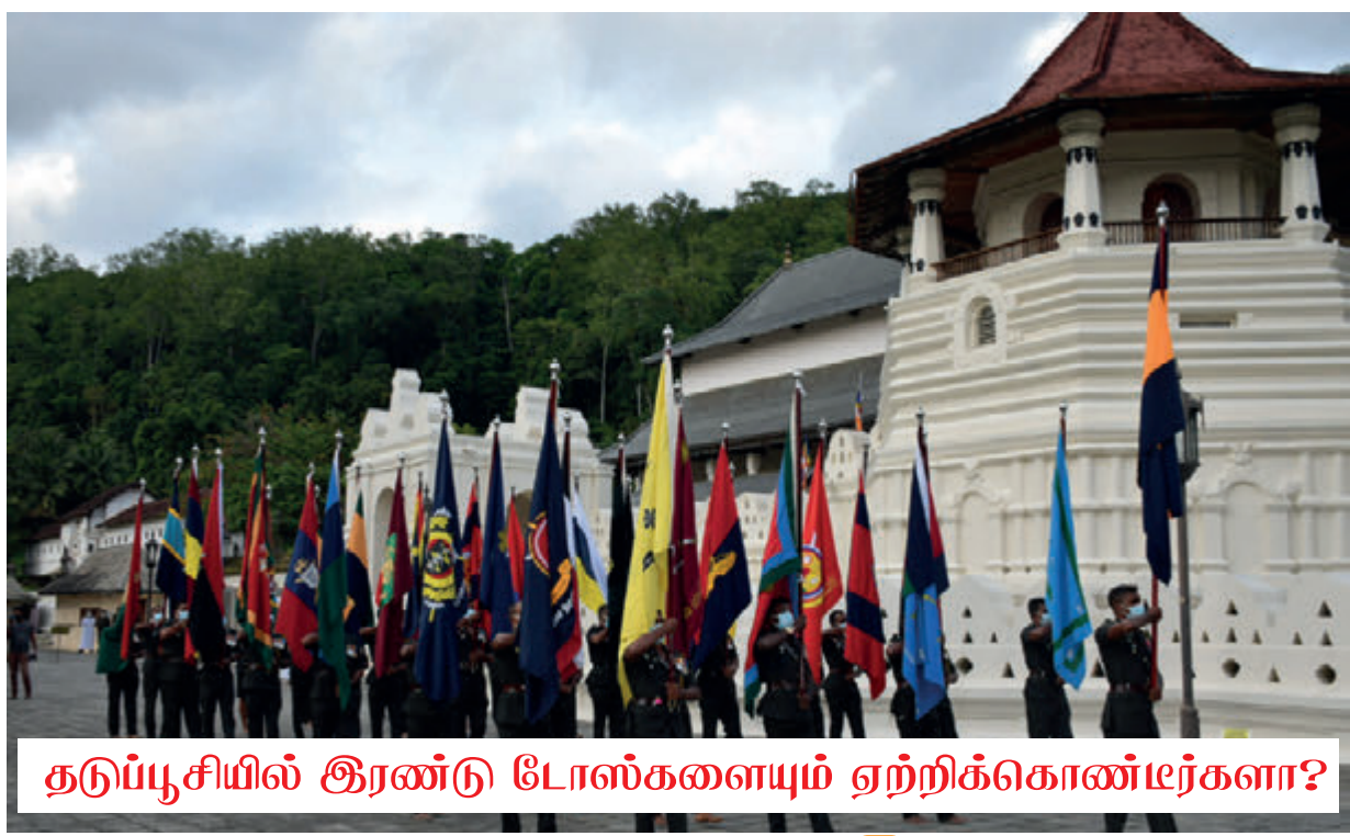
தடுப்பூசியில் இரண்டு டோஸ்களையும் ஏற்றிக்கொண்டீர்களா?