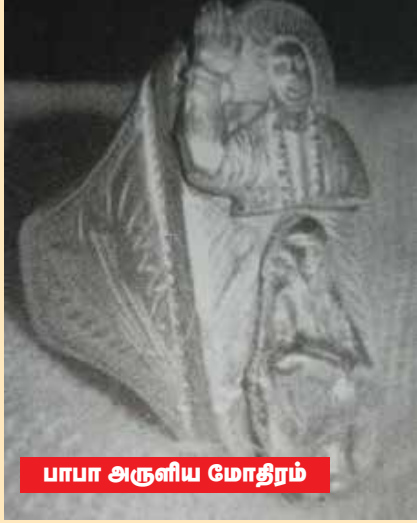
பாபா அருளிய மோதிரம்

'பிரசாந்தி நிலையத்துக்கு இதுவே என்முதல் வருகை. நான் அமெரிக்க நாட்டுப் பிரஜை. இன்றுதான் பகவான்