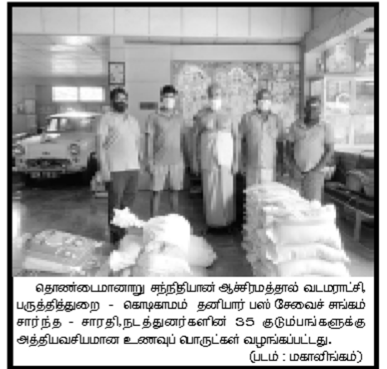
தொண்டைமானாறு சந்திப்பான ஆச்சிரமத்தால் வடமாகாட்சி, பருத்தித்துறை - கொடிக்காமம் தனியார் பஸ் சேவைச் சங்கம் சார்ந்த - சாரதி, நடத்துனர்களின் 35 குடும்பங்களுக்கு அத்தியவசியமான உணவுப் பொருட்கள் வழங்கப்பட்டது.

இலக்கங்களுக்கு எந்நேரமும் தொடர்புகளை ஏற்படுத்தி முறைப்பாடுகளை வழங்கலாம். இதன் மூலம் கிடைக்கும் முறைப்பாடுகளுக்கு ஏற்ப உடனடியாக நடவடிக்கை எடுக்கப்படும். மாகாணத்தில் உள்ள பொதுமக்கள் தமக்கு ஏதேனும் பாதுகாப்புப் பிரச்சினைகள் தொடர்பில் அச்சம் ஏற்பட்டால் எனது இணைப்புச் செயலாளர் மற்றும் பிரத்தியேகச் செயலாளரைத் தொடர்பு கொள்ள முடியும். பொதுமக்கள் தமது பிரச்சினைகளைத் தெரிவிப்பதற்காக எனது இணைப்புச் செயலாளரது தொலைபேசி இலக்கமான 0777229338 அல்லது பிரத்தியேக செயலாளர் இலக்கமான 0768095139 ஆகிய இலக்கங்களுடன் தொடர்பு கொள்ள முடியும் எனவும் அவர் மேலும் தெரிவித்தார். (4-7-18)