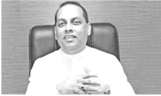
மிகப்பெரிய பொருளாதார அவர் தெரிவித்துள்ளார். (நி-5)