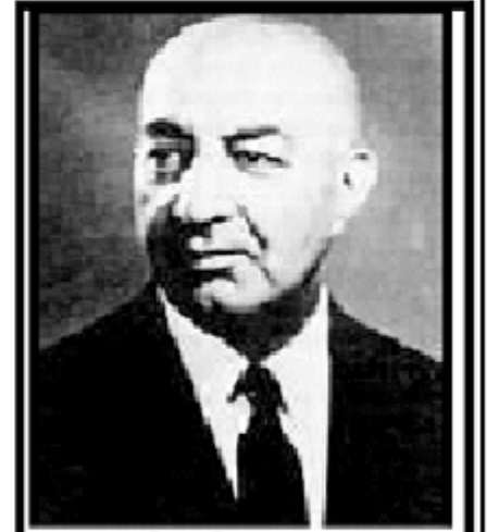
ஜனாதிபதி தாவுத் கான் 1973-1978

தாவுத் கானின் அரசாட்சியில் அவரது இரத்த சொந்தங்களின் ஆதிக்கம் அதிகம் இருந்தது. ஆப்கானிய மக்கள் ஜனநாயகக் கட்சி தாவுத் கானின் குடும்ப ஆட்சிக்கு எதிராகப் போராடத் தொடங்கியது. இதனிடையே அக்கட்சி ஆப்கானியர்களிடம் மிகுந்த செல்வாக்கைப் பெறத் தொடங்கியது. கம்யூனிச கொள்கைகளை அடிப்படையாகக் கொண்ட இரத்தக் கட்சியை சோவியத் ஆட்சியாளர்கள் தம்பக்கம் வளைத்து வைக்கிறார்கள். தாவுத் கானுக்கு எதிரான போராட்டங்கள் சூடுபிடிக்கத் தொடங்கின. தொடர்ந்த கலைக்களை அடுத்து 1978 ஏப்ரல் 27இல் புரட்சிக் குழுவால் கைது செய்யப்பட்ட தாவுத் கானும் அவரது குடும்பமும் படுகொலை செய்யப்பட்டனர். இது சவுத் புரட்சி என அழைக்கப்பட்டது. ஆப்கானிய மக்கள் ஜனநாயகக் கட்சியின் தலைவரான நூர்முகம் மது தரக்கி, புரட்சிக் குழுவின் ஜனாதிபதியாகவும் ஆப்கானிஸ்தான் ஜனநாயக குடியரசின் தலைவராகவும் நியமிக்கப்பட்டார். ஹ.பிசுக்கா அமீனும் பாப்ராக் கர்மாலும் துணைப் பிரதமர்களாயினர்.