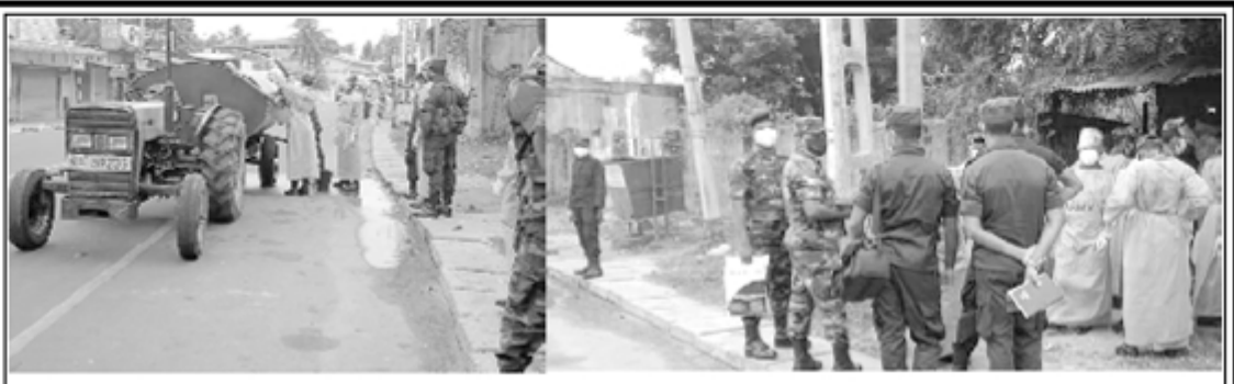
எள்ளம் குளம், பருத்தித்துறை மற்றும் கற்குளம் இராணுவத்தினர் ஒன்று சேர்ந்து பருத்தித்துறை சந்தை மற்றும் நகர்ப்புறம், மந்திகைச் சந்தை மற்றும் நகர்புறம், நெல்லியடி பஸ் நிலையம் சந்தைப் பகுதிகளில் சுகாதார நடைமுறைப்படி மருந்து தெளிக்கும் நடவடிக்கையில் நேற்றைய தினம் ஈடுபட்டிருந்தனர்.

ப்பட்டிருப்பதாகக் கிடைத்த தகவலின் அடிப்படையிலேயே இந்தக் கைது நடவடிக்கை முன்னெடுக்கப்பட்டமை குறிப்பிடத் தக்கது. மேலும் மருதங்கேணி தாளையடி பகுதியில், கடல் மார்க்கமாகக் கடத்தி வரப்பட்ட மஞ்சளை இருவர் வாகனத்தில் ஏற்றிக்கொண்டு இருந்த போது, மருதங்கேணி பொலிஸாருக்கு கிடைக்கப்பெற்ற இரகசிய தகவலின் அடிப்படையில் சம்பவ இடத்திற்கு விரைந்த பொலிஸார் மஞ்சளை ஏற்றிக்கொண்டு இருந்த இருவரையும் கைது செய்துள்ளனர். அதன் போது 372 கிலோ மஞ்சள் பொலிஸாரினால் மீட்கப்பட்டுள்ளது. (7-5-18-33)