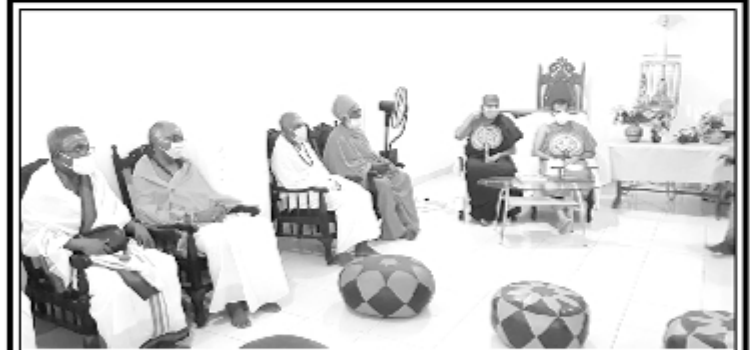
கொரோனாத் தொற்றால் மரணித்தவர்களுக்காகவும் கொரோனாத் தொற்றாளர்களைப் பாதுகாப்பாகவும் மற்றும் வைத்திய சாலையில் பணியாற்றுகின்ற பணியாளர்கள் நோய் தொற்று இல்லாமல் இருக்க வேண்டியும் ஸ்ரீ நாகவிசாரை சர்வதேச பௌத்த நிலையத்தின் ஏற்பாட்டில் இந்து-பௌத்த இறை ஆசி வேண்டி சிறப்பு புகை வழிபாடு நேற்று யாழ்ப்பாணம் நாகவிசாரை சர்வதேச பௌத்த மத்தியஸ்தான நிலையத்தில் இடம்பெற்றது.