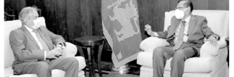
தெரிவித்தார். மேலும் இலங்கையின் நீண்டகால அணிசேரா பாரம் பரியத்தின் பின்னணியில் பிரேசில் மற்றும் முழுமையான தெற்கு மற்றும் மத்திய அமெரிக்கப் பிராந்தியத்துடன் வலுவான உறவுகளைப் புதுப்பிக்கவும் அமைச்சர் தனது ஆர்வத்தைத் தெரிவித்தார். (4-5)