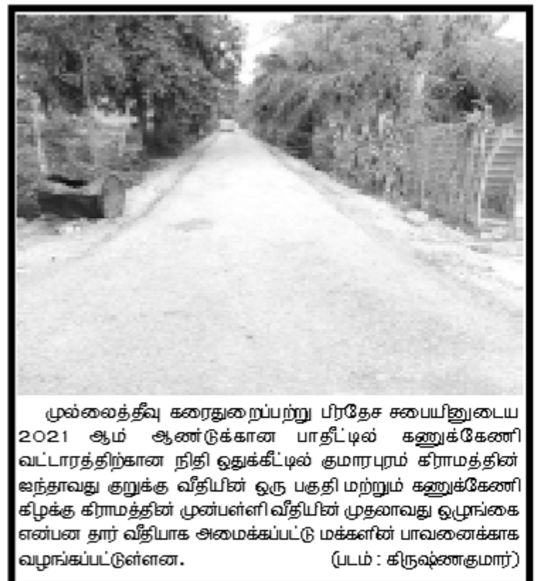
முல்லைத்தீவு கரைதுறைப்பற்று பிரதேச சபையினுடைய 2021 ஆம் ஆண்டுக்கான பாதீட்டில் கணுக்கேணி வட்டாரத்திற்கான நிதி ஒதுக்கீட்டில் குமாரசுரம் கிராமத்தின் ஊந்தாவது குறுக்கு வீதியின் ஒரு பகுதி மற்றும் கணுக்கேணி கிழக்கு கிராமத்தின் முன்பள்ளி வீதியின் முதலாவது ஒழுங்கமைப்பை தார் வீதியாக அமைக்கப்பட்டு மக்களின் பாவனைக்காக வழங்கப்பட்டுள்ளன.