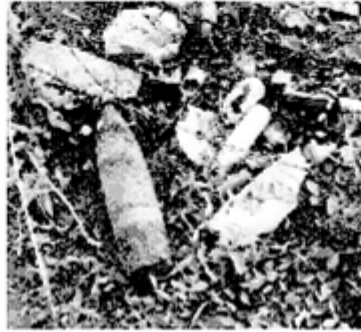
டது. குறித்த வெடிபொருளை மீட்பதற்கான நடவடிக்கைகளை பொலீஸார் மேற்கொண்டு வருகின்றனர். (ம-03,104)

இதனைத் தொடர்ந்து பொலீஸாருக்கு தகவல் வழங்கப்பட்டது.