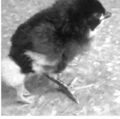
(கல்முனை) அம்பாறை மாவட்டம் கல்முனைக்

குடி பிரதேசத்தின் கடற்கரைப்பள்ளி வீதியில் அமைந்துள்ள வீடொன்றில் நான்கு கால்களுடன் பிறந்த கோழிக்குஞ்சு அனைவரது கவனத்தையும் ஈர்த்துள்ளது. வீட்டு உரிமையாளரால் நாட்டுக் கோழி வளர்ப்பதற்காக அடைக்க வைக்கப்பட்ட முட்டைகளிலிருந்து ஏழு கோழிக்குஞ்சு பிறந்துள்ள நிலையில் அதில் ஒன்றே இவ்வாறு பிறந்துள்ளது. இதனை காணும் சிறுவர்கள் சிறுவர் தினமான நேற்று தங்களுக்கான சிறுவர் தின பரிசாக நினைத்து மகிழ்ச்சியடைந்துள்ளனர். (4-5)