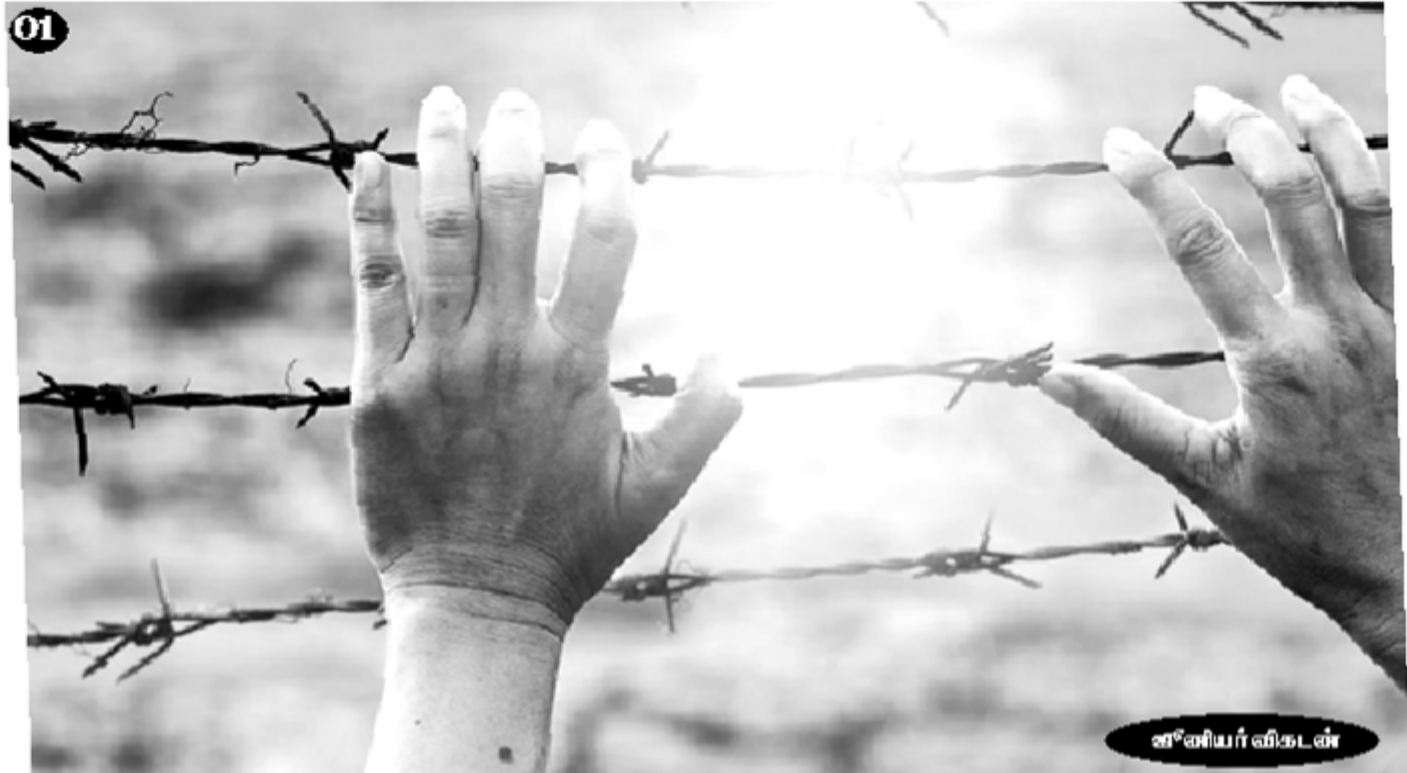
01 புதுவிதமான பீதியைக் கிளப்பியது.

முல்லைத்தீவு - கேரளா - இந்தோசேசியா பக்கங்களிலிருந்து சுமாத்ரா கடலை வெட்டியோடி வந்த தமிழ் அகதிப் படகுகளால், ஏற்கனவே மீறண்டு போயிருந்த அவுஸ்திரேலிய கடற்படையினருக்கு, ஆப்கான்களின் படகும் படைபெடும்பு