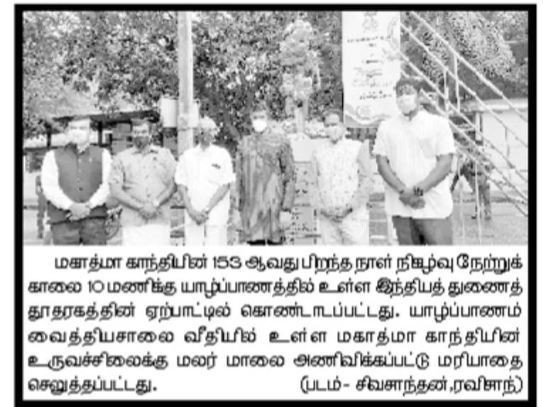
மகாத்மா காந்தியின் 153 ஆவது பிறந்த நாள் நிகழ்வு நேற்றுக் காலை 10 மணிக்கு யாழ்ப்பாணத்தில் உள்ள இந்தியத் துணைத்தூதரகத்தின் ஏற்பாட்டில் கொண்டாடப்பட்டது. யாழ்ப்பாணம் வைத்தியசாலை வீதியில் உள்ள மகாத்மா காந்தியின் உருவச்சிலைக்கு மலர் மாலை அணிவிக்கப்பட்டு மரியாதை செலுத்தப்பட்டது.

மாத்திரம் அல்ல. எனவே தென்மராட்சி பிரதேச செயலகமும் சாவகச்சேரியில் மின் மயானம் அமைக்கும் விடயத்தில் முயற்சி எடுக்க வேண்டும். இதனுடாக கொரோனா நோய்த் தாக்கம் காரணமாக உயிரிழப்பவர்களது சடலங்கள் வேறு மாவட்டங்களுக்கு அனுப்பி வைத்தல், வைத்தியசாலையில் தேக்கிவைத்தல் உள்ளிட்ட சிரமங்களை தவிர்க்க முடியும் என மேலும் அவர் தெரிவித்திருந்தார். (7-5-30)