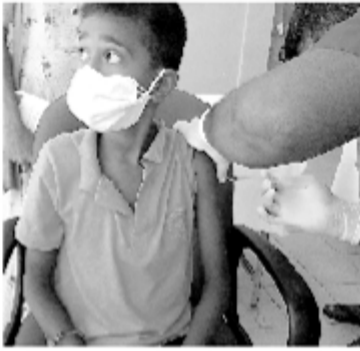
த்த நாட்பட்ட நோயையு டைய பதிவு செய்யாத சிறு வர்கள் அருகிலுள்ள சுகா தார வைத்திய அதிகாரிபணி மனையில் பெயர்களை பதிவு செய்து கொள்ள முடி யும் எனவும் தெரிவித்தார். பெற்றோர்கள் குறித்த சந்தர்ப்பத்தை தவறவிடாது பிள்ளைகளை அழைத்து வந்து தடுப்பூசிகளை பெற் றுக் கொள்ளுமாறு தெரி வித்தார். (7-5-6-316)