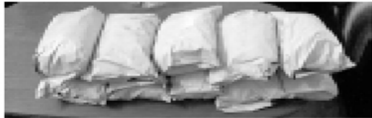
பொலிஸாருக்கு கிடைக்கப்பெற்ற இரகசிய தகவலையடுத்து, லொறியை சோதனை செய்த போது மறைத்து வைக்கப்பட்ட 10 பொதிகளை கொண்ட 10 கிலோ ஐஸ் போதைப் பொருட்களை பொலிஸார் மீட்டுள்ளனர். மேலும் குறித்த லொறியின் சாரதி மற்றும் ஒருவரை கைது செய்தனர். கைது செய்யப்பட்ட சந்தேக நபர்கள் வவுனியாவைச் சேர்ந்த 30 மற்றும்

மன்னார்-மதவாச்சிபிரதான வீதி, முருங்கன் பொலிஸ் பிரிவுக்குட்பட்ட பகுதியில் சுமார் 10 கிலோ கிராம் ஐஸ் போதைப் பொருட்களுடன் இருவர் நேற்று முன்தினம் வெள்ளிக்கிழமை கைது செய்யப்பட்டுள்ளதாக பொலிஸார் தெரிவித்துள்ளனர்.