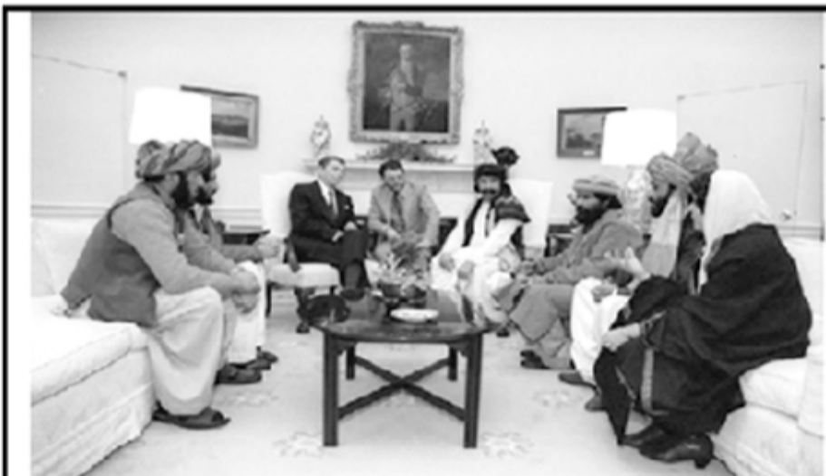
1983ல் அமெரிக்க அதிபர் ரொனால்ட் ரீகன், முஜாகிதீன் தலைவர்களை வெள்ளை மாளிகைக்கு அழைத்துப் பேசினார்.

பிற்சீனை காரணமாக, சீனாவும் இவர்களுக்கு உதவியது. ஆரம்பத்தில் பாசிஸ்தானில் வைத்துக் கிளர்ச்சியாளர்களுக்கு பயிற்சியளித்த சீனா, பின்பு சீனாவுக்கே அதன் முக்கிய வீரர்களை அழைத்துப் பயிற்சி கொடுத்தது.