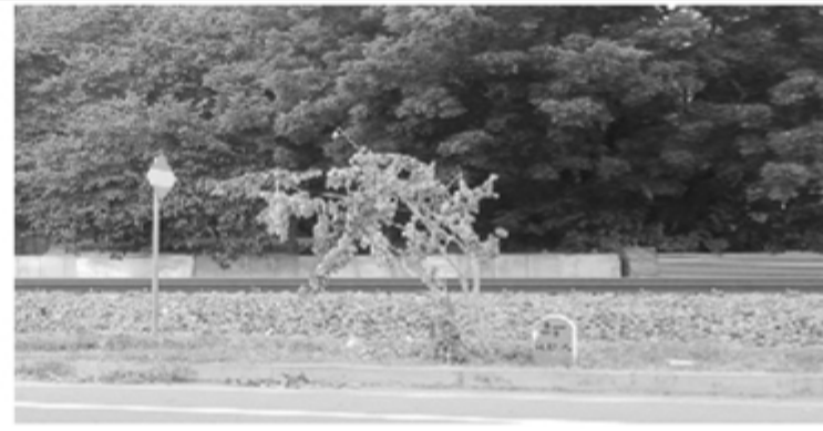
சபை எல்லைக்குட்பட்ட பகுதி களில் வீதியோரங்களில் மரங் களை நாடிப் பராமரித்து வருகின் றமை குறிப்பிடத்தக்கது. (7-5-30)

(சாவகச்சேரி) சாவகச் சேரி-சங் கத் தானைப் பகுதியில் ஏ9 வீதி யோரம் நாட்டப்பட்டிருந்த நிழல் மரங்கள் இனந்தெரியா தோரால் தீ வைத்து அழிக்கப் பட்டுள்ளது. பசுமை நிழல்கள் அமைப்பினரால் வைத்துப் பராம ரிக்கப்பட்டு வந்த வீதி ஓர நிழல் மரங்களே இவ்வாறு தீ வை த்து நாசமாக்கப்பட்டுள்ளன. குறித்த அமைப்பினர் சாவகச் சேரி நகரசபை மற்றும் பிரதே