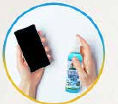
உங்கள் துணைப்பொருட்களுக்கு உபயோகிக்கவல்லது