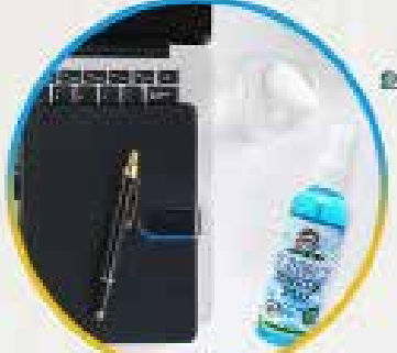
உங்கள் இல்லத்தை மற்றும் பணியிடத்தை சுத்தமாக வைக்க உதவுகின்றது