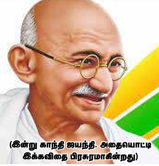
(இன்று காந்தி ஜயந்தி. அதையொட்டி இக்கவிதை பிரசுரமாகின்றது)

வையமெலாம் வணங்கும்படி வாழ்ந்துவிட்டார் காந்திமகான்!