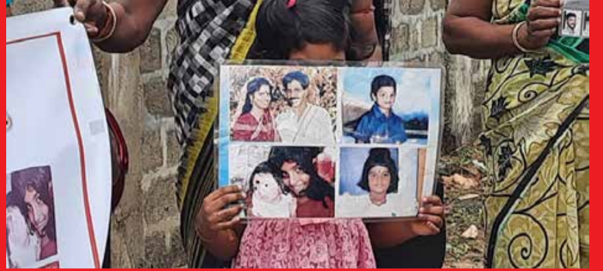
ஐக்கிய நாடுகள் உயர்ஸ்தானிகரின் யாழ்ப்பாணம் பிராந்திய அலுவலகத்துக்கு முன்னால் கவனவீர்ப்புப் போராட்டத்தில் ஈடுபட்டனர்.

வலிந்து காணாமல் ஆக்கப்பட்டோரின் உறவினர்கள்,