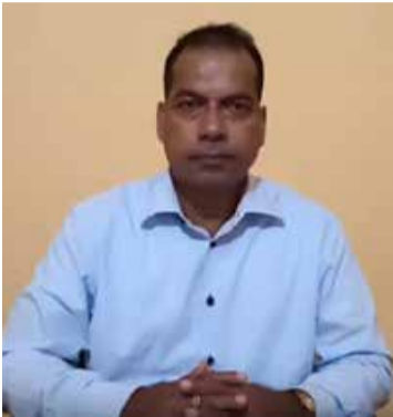
கத்துக்கு உறுதுணையாக இணைந்து செயற்படுகின்ற பல அமைப்புகளும் வெளிநாடுகளில் இருக்கின்றன. அத்தகைய அமைப்புகளோடு அரசாங்கம் பேசுவார்களாக இருந்தால் அதனைத் தமிழ் மக்கள் ஏற்றுக் கொள்ளமாட்டார்கள்.

பேச்சு நடத்தப் போகிறார் என ஐ.நா. மனித உரிமை ஆணையாளருக்கு தெரிவித்திருக்கின்றார். வெளிநாடுகளில் குறிப்பாக அமெரிக்கா, பிரித்தானியா, கனடா, ஐரோப்பிய நாடுகளில் புலம்பெயர் தேசங்களில் இயங்கக்கூடிய அமைப்புகளை இலங்கை அரசாங்கம் தடை செய்திருக்கின்றது. கறுப்புப் பட்டியலில் சேர்த்து இருக்கின்றது. அந்த அமைப்புகள் எல்லாம் தமிழ் மக்களுக்காகக் குரல் கொடுக்கின்ற தொடர்ச்சியாக போராடுகின்ற அமைப்புகளை, கடந்த காலங்களில் பயங்கரவாதத்துக்குத் துணை போகின்ற அமைப்புகளாக முத்திரை குத்தி தடை செய்தனர். ஆனால் அந்த அமைப்புகளைத் தடை செய்து வைத்துக்கொண்டு அந்த அமைப்புகளோடு பேசப் போகின்றோம் என்ற செய்தி நகைப்புக்கிடமாக எண்ணத் தோன்றுகின்றது. அரசாங்கம் முதலில் அந்த அமைப்புகளைத் தடைப்படியவில்லை இருந்து நீக்க வேண்டும். அத்தோடு அரசாங்கத்துக்கு உறுதுணையாக இணைந்து செயற்படுகின்ற பல அமைப்புகளும் வெளிநாடுகளில் இருக்கின்றன. அத்தகைய அமைப்புகளோடு அரசாங்கம் பேசுவார்களாக இருந்தால் அதனைத் தமிழ் மக்கள் ஏற்றுக் கொள்ளமாட்டார்கள். வடக்கு கிழக்கிலே பெரும்பான்மையான தமிழ்த் தேசியம் சார்ந்த கட்சிகள் இருக்கின்றன. நாடாளுமன்றத்திலும் பலர் பங்கு கொண்டிருக்கின்றார்கள். இந்த இனப்பிரச்சினை விவகாரங்களை எங்களை விடுத்து புலம்பெயர் அமைப்புகளோடு பேசப்போகிறோம் என்று சொல்கின்றமையை ஏற்றுக் கொள்ள முடியாது. அதே நேரத்தில் புலம்பெயர் அமைப்புகள் குறிப்பாக, சில நிபந்தனைகளை விதித்து இருக்கின்றன. இதய சுத்தியுடன் அரசாங்கம் தமிழர்களின் விடயத்தில் நேர்மையாக நீதியாக நடக்கவேண்டும். வெளிநாடுகளிலே ஒரு பேச்சு இலங்கையிலே இன்னொரு பேச்சு. இப்படியாக இரட்டைவேடம் போடுகின்ற இந்த அரசியலை அரசாங்கம் உடனடியாக நிறுத்த வேண்டும். -என்றார்.