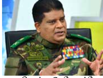
பான செயற்பாடுகளே ஒக்ரோபர் மாதத்தின் நிலைமையைத் தீர்மானிக்கும். ஒரு மாதத்துக்கும் அதிக

வின் பேராபத்தை நாடு எதிர்கொண்டே தீரும்.” - இவ்வாறு கொரோனாதடுப்புக்கான தேசிய செயற்பாட்டு மத்திய நிலையத்தின் தலைவரும் இராணுவத் தளபதியுமான ஜெனரல் சவேந்திர சில்வா தெரிவித்தார். இது தொடர்பில் அவர் மேலும் தெரிவித்ததாவது:- நாட்டில் தனிமைப்படுத்தல் ஊரடங்கு சட்டம் நீக்கப்பட்டபோதிலும் மக்களின் பொறுப்பற்ற