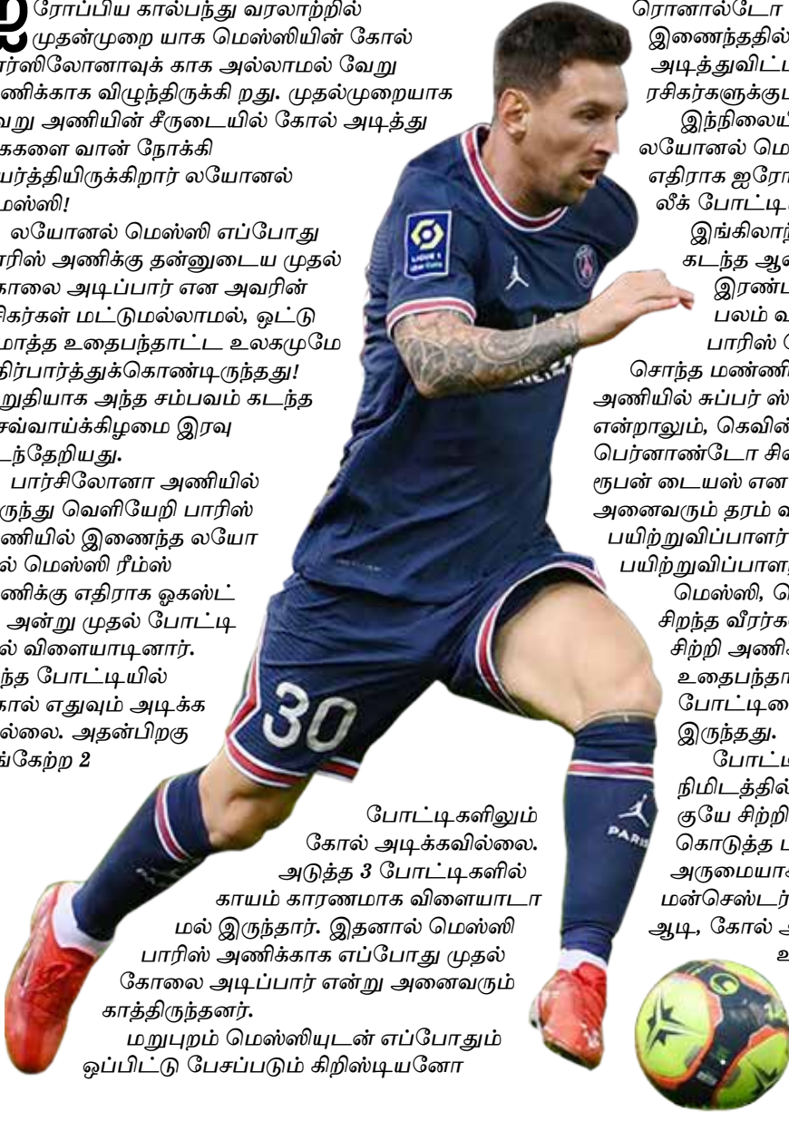
போட்டிகளிலும் கோல் அடிக்கவில்லை. அடுத்த 3 போட்டிகளில் காயம் காரணமாக விளையாடாமல் இருந்தார். இதனால் மெஸ்ஸி பாரிஸ் அணிக்காக எப்போது முதல் கோலை அடிப்பார் என்று அனைவரும் காத்திருந்தனர். மறுபுறம் மெஸ்ஸியுடன் எப்போதும் ஒப்பிட்டு பேசப்படும் கிறிஸ்டியனோ

மெஸ்ஸியின் கோல் வேட்டைத் தொடர் வேண்டும் என வேண்டுகளில் இறங்கிவிட்டார்கள் மெஸ்ஸி ரசிகர்கள்!