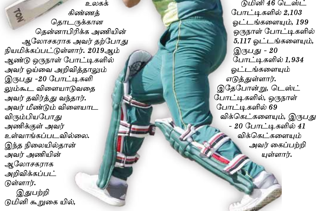
உலகக் கிண்ணத் தொடருக்கான தென்னாபிரிக்க அணியின் ஆலோசகராக அவர் தற்போது நியமிக்கப்பட்டுள்ளார். 2019ஆம் ஆண்டு ஒருநாள் போட்டிகளில் அவர் ஓய்வை அறிவித்தாலும் இருபது - 20 போட்டிகளிலும் கூட விளையாடுவதை அவர் தவிர்த்து வந்தார். அவர் மீண்டும் விளையாட விரும்பியபோது அணிக்குள் அவர் உள்வாங்கப்படவில்லை. இந்த நிலையில்தான் அவர் அணியின் ஆலோசகராக அறிவிக்கப்பட்டுள்ளார். இதுபற்றி டுமினி கூறுகையில்,

டுமினி 46 டெஸ்ட் போட்டிகளில் 2,103 ஓட்டங்களையும், 199 ஒருநாள் போட்டிகளில் 5,117 ஓட்டங்களையும், இருபது - 20 போட்டிகளில் 1,934 ஓட்டங்களையும் எடுத்துள்ளார். இதேபோன்று, டெஸ்ட் போட்டிகளில், ஒருநாள் போட்டிகளில் 69 விக்ரெட்ட்களையும், இருபது - 20 போட்டிகளில் 41 விக்ரெட்ட்களையும் அவர் கைப்பற்றியுள்ளார்.