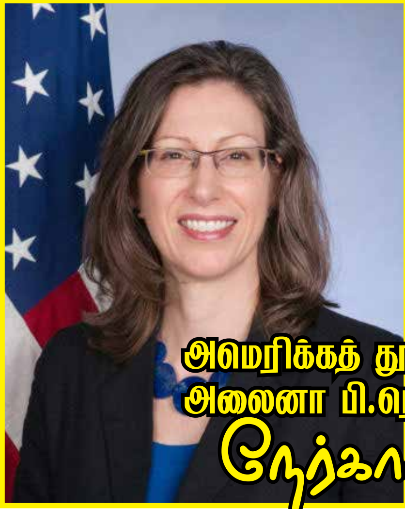
அமெரிக்கத் தூதுவர் அலைனா பி.ரெப்லிட்ஸ் டேர்ஊட்டில்

“ வ ன்முறையால் பாதிக்கப்பட்டவர்கள் நீதியையும் பொறுப்புக்கூறலுக்கான பொறிமுறையையும் பெற உரித்துடையவர்கள். சகல மக்களுக்கும் பொறுப்புக்கூறும் கடப்பாடுடைய அரசாங்கம் ஒன்று குற்றவியல் முறைப்பாடுகளை மெய்யாகவும் நம்பகத்தன்மையுடனும் விசாரித்து சம்பந்தப்பட்டவர்கள் மீது வழக்குத்தொடுக்க முன்வரவேண்டும்