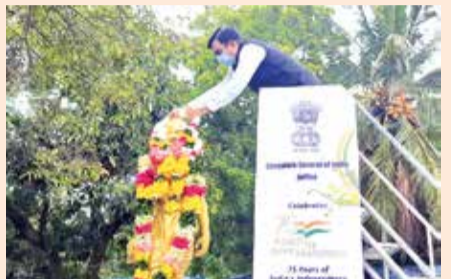
யாழ் மாநகர முதல்வர் உள்ளிட்டவர்கள் பங்கேற்றனர்.