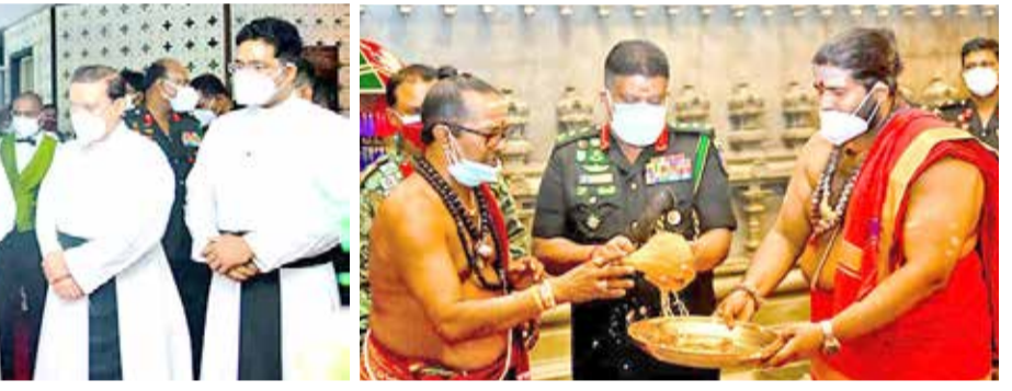
இலங்கை இராணுவத்தின் 72 ஆண்டு நிறைவை முன்னிட்டு கொழும்பு மயூராபதி அம்மன் தேவஸ்தானம், கொள்ளப்பிட்டி ஜும்மா பள்ளிவாசல், பொரளை அனைத்து புனிதர்கள் தேவாலயம் ஆகியவற்றில் விசேட பூஜை வழிபாடுகள் இடம்பெற்றன. இராணுவத்தளபதி ஷவேந்திர சில்வா உள்ளிட்ட இராணுவ உயர் அதிகாரிகள் இந்த வழிபாடுகளில் கலந்துகொண்டனர்.