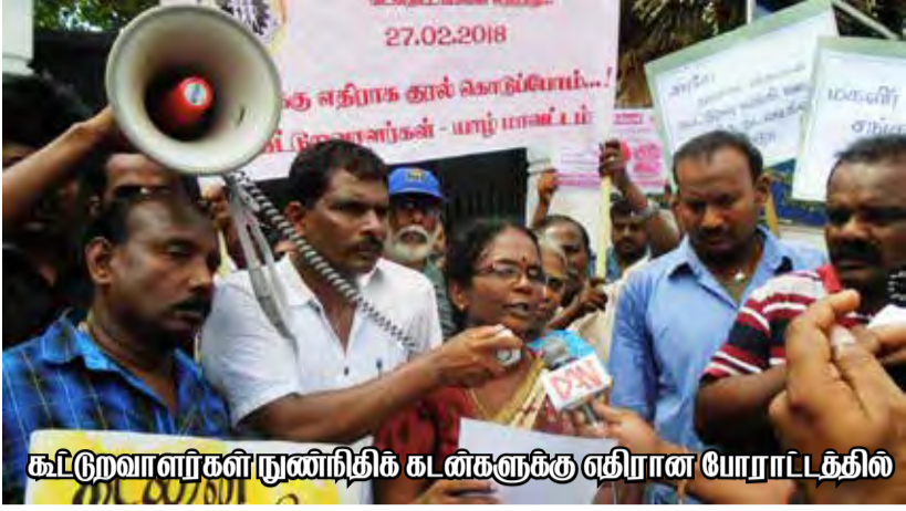
கட்டுறவாளர்கள் நுண்ணிதிக்க கடிகளுக்கு சீரான யோராட்டத்தில்

எமது நாட்டின் கிராமிய பொருளாதார அபிவிருத்தியை பார்க்கின்ற போது எல்லா காலத்திலும் வாய்ப்பை உருவாக்கி கொடுத்ததில் விவசாயம் முக்கிய இடத்தை பெறுகின்றது. இலங்கை போன்ற விவசாய நாட்டில் மக்களுடைய விவசாய அல்லது மக்களுடைய உற்பத்தி சார்ந்த வளர்ச்சிக்கும் விருத்திக்கும் இன்றியமையாத ஒன்றாக கூட்டுறவுத்துறை காணப்படுகின்றது. இதனால் தான் 1940களில் விவசாய விளைபொருள் உற்பத்தி விற்பனை கூட்டுறவு சங்கங்கள் ஆரம்பிக்கப்பட்டது. அது வேகமாக வளர்ச்சியடைந்து 1958களில் கிட்டத்தட்ட 2000வரையான விவசாய உற்பத்தி கூட்டுறவு சங்கங்களாகி விவசாயிகளின் இடையே வாழ்வாதார தேவைகளுக்கு இன்றியமையாத ஒரு அமைப்பாக இருந்தன. அதே போல கிராமிய மக்களுக்கு கடன்களை வழங்குவதற்காக சிக்கன கடன் வழங்கும் கூட்டுறவு சங்கங்கள் வளர்ச்சி பெற்றன.