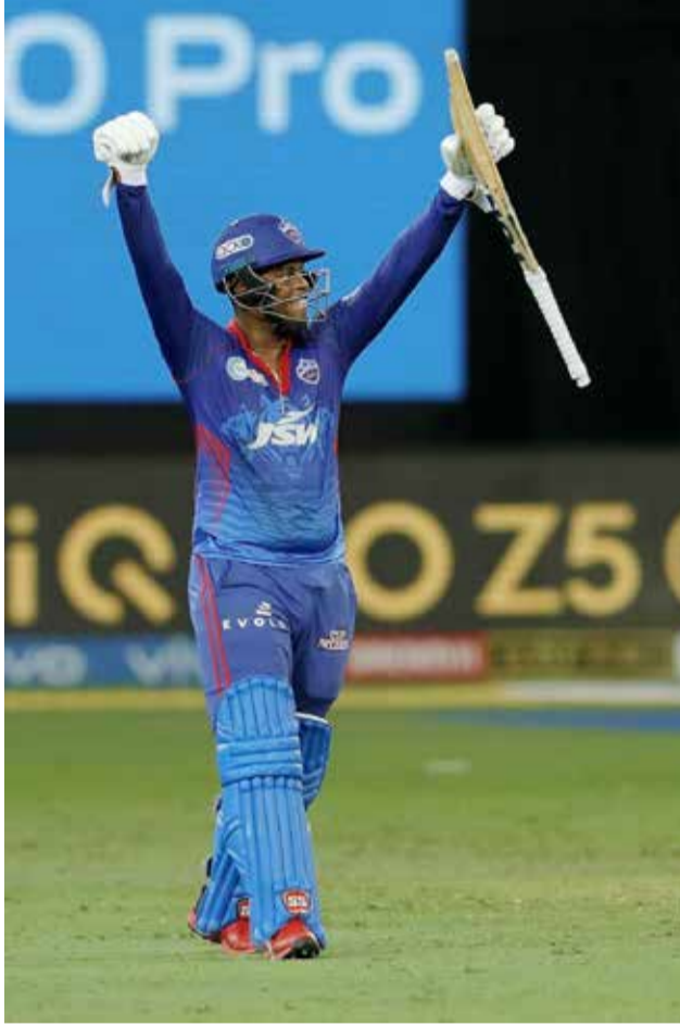
திருப்புமுனையை ஏற்படுத்தியதால் ஆட்டநாயகன் விருது வழங்கப்பட்டது.

ஆனால், ஆட்டநாயகன் விருது என்னவோ அக்ஸர் பட்டேலுக்குதான் வழங்கப்பட்டது. 4 ஓவர்கள் வீசி 18 ஓட்டங்கள் கொடுத்து 2 விக்கெட்களை வீழ்த்தி அக்ஸர் பட்டேல் 6 டாட் பந்துகளை வீசினார், ஒரு பௌண்ட்ரி, சிக்ஸர்கூட தனது ஓவரில் சென்னையின் துடுப்பாட்ட வீரர்களை அடிக்கவிடவில்லை. அதுமட்டுமல்லாமல் அதிரடி துடுப்பாட்டத்தை வெளிப்படுத்திய டி பிளாசிஸ், மொயின் அலி இருவர் விக்கெட்டையும் வீழ்த்தி