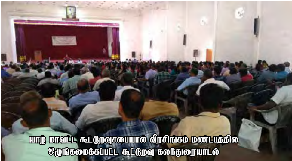
யாழ் மாவட்டக் கூட்டுறவுசபையால் வீரசிங்கம் மண்டபத்தில் ஒருங்கமைக்கப்பட்ட கூட்டுறவு கலந்துரையாடல்

குறிப்பாக எங்களுடைய பிரதேசங்களை பொறுத்த வரை அரசியல் ஆதரவு இல்லாமல் கூட்டுறவை முற்று முழுதாக வளர்க்கலாம் என்று கூறமுடியாது. எங்களுடைய பிரதேசத்திலே அரசியல் ரீதியாக மாகாண அரசுகள் உருவாக்கப்பட்டன. ஆனால் மாகாண சபைகள் உருவாக்கப்பட்ட போதிலும் அவை இந்த கிராமிய பொருளாதார அபிவிருத்தியில் போதுமான சவனம் செலுத்தியதாகவில்லை காரணம் அடிமட்டத்திலிருந்து உருவாக்கப்பட்ட தலைவர்கள் அங்கு இல்லாமை ஒரு காரணமாக உள்ளது. இன்று எங்களுடைய அரசியல் ரீதியாக உருவாக்கப்பட்டிருக்கும் பிரதேச சபைகளாக இருக்கலாம். மாகாணசபைகளாக இருக்கலாம் இல்லை மத்திய அரசினுடைய பாராளுமன்ற உறுப்பினர்களாக இருக்கலாம் கிராமிய மட்டத்தில் இருந்து மக்களுடைய துன்பங்களை தீர்க்கக் கூடியவர்கள் இதிலே அக்கறை கொண்டு இந்த கூட்டுறவை வளர்க்க முன்வர வேண்டும்.