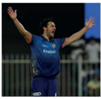
ட.ரெண்ட் போல்ட் 0/24 (4), கொரன் பொலார்ட் 0/9 (2)

இ ந்தியன் பிரிமியர் லீக்கில், ஐக்கிய அரபு அமீரகத்தின் ஷார்ஜாவில் நேற்று முன்தினம் இரவு நடைபெற்ற ராஜஸ்தான் ரோயல்ஸுடனான போட்டியில் மும்பை இந்தியன்ஸ் வென்றது. ஸ்கோர் விவரம்: ராஜஸ்தான் சுமர்ச்சி: மும்பை ராஜஸ்தான்: 90/9 (20 ஓவ.) (பந்துவீச்சு: தேவன் கூல்டர்நைல் 4/14 (4), ஜேம்ஸ் நீஷம் 3/12 (4), ஜஸ்பிரிட் புர்மா 2/14 (4),