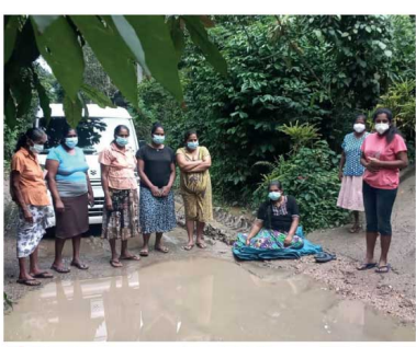
விதியை புரளமைக்க கோரி