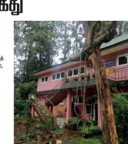
செய்யப்படுவதாகவும் தெரிவிக்கப்படுகின்றது. சம்பவம் தொடர்பில் துவரெலியா பொலீஸார் விசாரணைகளை மேற்கொண்டு வருகின்றனர்.