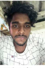
இளைஞர் தொடர்பில், கட்டுநாயக்க எவரித்தலை போலீஸ் நிலையத்தில் முறைப்பாடு செய்துள்ளதாக இளைஞரின் தந்தை தெரிவித்துள்ளார். இவர் குறித்த தகவல்கள் தெரிவித்தால் 0777548388, 0718785457, 0768110065 என்ற தொலைபேசி இலக்குகளுக்கு அழைக்குவதும் தெரிவிக்கப்பட்டுள்ளது.