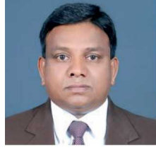
தொழிற்சங்க நடவடிக்கைகளை முன்னெடுப்பதை தவிர்த்துக் கொள்ள வேண்டும். எனவே மலையக மக்கள் முன்னணியையும் மலையக தொழிலாளர் முன்னணியையும் பலவீனப்படுத்தும் நடவடிக்கைகளை முன்னெடுக்கிறவர்களை எந்த காரணம் கொண்டும் மீண்டும் இணைத்துக் கொள்வதற்கான வாய்ப்புகள் இல்லை. (மலையக மக்கள் முன்னணியின் சின்னம் மன்வெட்டை என்பது குறிப்பிடத்தக்கது)

மேற்கொள்ள வேண்டும் எனவும் கோர்க்கை முன்னையதுள்ளார். இந்த அமைப்பில் இருந்து வெளிப்பெறியவர்களும் வெளிப்பெறப்படாதவர்களும் தங்களுக்கு தீவிர இயக்கங்கள், மக்களிடம் செல்வதற்கு இருக்குமாக இருந்தால், அவர்கள் அவர்களுடைய அரசியல் தொழிற்சங்க நடவடிக்கைகளை சுயமாக தாம் களத்தில் உருவாக்கப்பட்டு கட்சியையும் தொழிற்சங்கத்தையும் அதன் பெயரையும் பண்படுத்தி முன்னெடுக்க வேண்டும். எங்களுடைய அமைப்புகளுக்கு பின்னால் ஒழிந்து கொண்டே அரசியல்