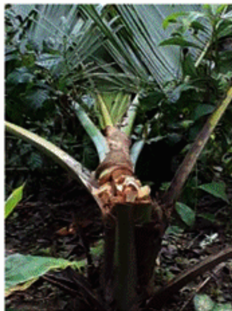
மேலும் இந்த மக்கள் 60 வருடங்களுக்கு மேலாக தமக்கு தேவையானவற்றை உற்பத்தி செய்து வாழ்வாதாரத்தை