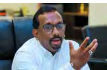
கொழும்பு, ஒக்ட. 10

பாடசாலை நடவடிக்கைகளை மீண்டும் தொடங்குவதற்கு அதிபர்களும் ஆசிரியர்களும் ஆதரவை வழங்கவேண்டும் என அமைச்சர் மஹிந்தானந்த கூறுகிறார்