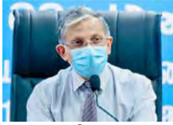
கொழும்பு, ஒக்ட. 10