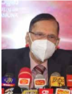
சபைத் தேர்தல் நடைபெறவுள்ளதாக வெளியாகும் கருத்துகளையும் அவர் நிராகரித்தார்.

பழைய முறையிலேயே மாகாணசபைத் தேர்தல் நடத்தப்படும் எனவும், இதற்கான சட்ட ஏற்பாடுகள் விரைவில் முன்வைக்கப்படும் எனவும் அமைச்சர் ஜி.எல்.பீரிஸ் தெரிவித்தார்.