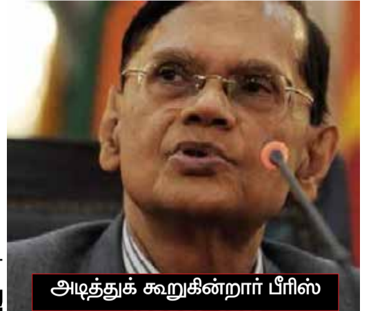
அடித்துக் கூறுகின்றார் பீரிஸ்

இதனையடுத்து, 50 கிலோ சீமெந்து மூடையின் தற்போதைய விலை 1.098 ரூபாவாக அதிகரிக்கப்பட்டுள்ளது. இதேவேளை, கோதுமை மா கிலோவொன்றின் விலையை 10 ரூபாவால் அதிகரிக்க செரண்டிப் கோதுமை மா ஆலை நிறுவனம் தீர்மானித்துள்ளது.