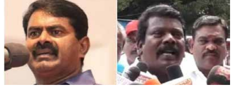
வாயைத் திறக்க மாட்டேன் கிறார்.