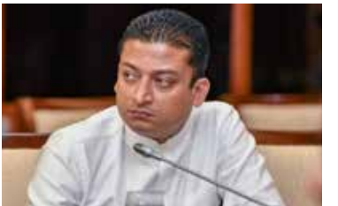
பஸ்களுக்கு அனுமதி வழங்கப்பட்டுள்ளமை குறிப்பிடத்தக்கது.

பயணக்கட்டுப்பாடு விதிக்கப்பட்டிருந்தாலும் வைத்தியசாலை ஊழியர்களுக்காக மாகாணங்களுக்கு இடையில் பயணிப்பதற்காக 17