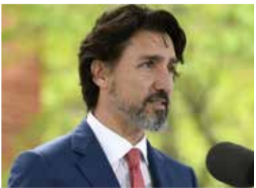
ரொறன்ரோ, ஒக். 14

ஆப்கானிஸ்தான் நாட்டை சேர்ந்த 40 ஆயிரம் அகதிகளை ஏற்றுக்கொள்வதாக கனடிய அரசாங்கம் அறிவித்துள்ளது. அத்துடன், அகதிகளை மீளக் குடியமர்த்துவதற்கான ஆதரவை அதிகரிக்குமாறு ஏனைய நாடுகளை கனடா வலியுறுத்தியுள்ளது.