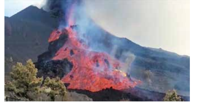
நிலையில், வெளியேறிய எரிமலைக் குழம்பால் 595 ஹெக்டெயர் நிலப் பரப்பு அழிவடைந்துள்ளன. 1281 கட்டடங்களும் தீயால் அழிந்தன. இந்த நிலையில், மேலும் சீற்றம் அதிகரித்துள்ளமையால் மேலும், 800 பேர் பாதுகாப்பான

இதையடுத்து அந்தப் பகுதியிலிருந்து 6 ஆயிரத்துக்கும் மேற்பட்டவர்கள் வெளியேற்றப்பட்டனர். 25 நாட்கள் கடந்தும் எரிமலையின் சீற்றம் நாளுக்கு நாள் அதிகரித்து வருகின்றது. இந்த