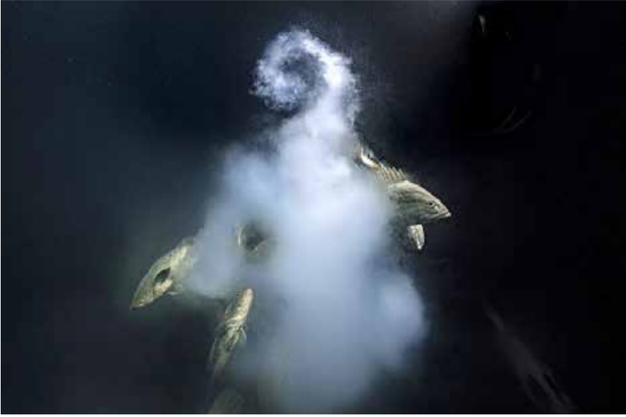
உருமறைப்பு களவாய் (camouflage groupers) ஆண் மீன்கள் பல்லாயிரக் கணக்கில் கூடி இனப்பெருக்கத்தின்போது விந்தணுக்களை அவசரமாக வெளியிடும்போது எடுக்கப்பட்ட படம் இது. இந்தப் படத்தை எடுத்த லோரண்ட் பல்லெஸ்டா இந்த ஆண்டுக்கான சிறந்த வன உயிர் புகைப்பட விருதை வென்றுள்ளார். இவர் 3000 மணி நேரம் நேரில் மூழ்கியிருந்து இந்தப் படத்தை எடுத்துள்ளார்.