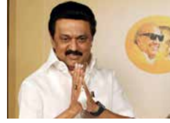
திமுக ஆட்சிக்குக் கிடைத்த நற்சான்று.

சென்னை, ஒக். 14 மக்கள் மத்தியில் ஐந்தாண்டில் கிடைக்க வேண்டிய நம்பிக்கை 5 மாதத்தில் கிடைத்து விட்டது என்று உள்ளாட்சித் தேர்தல் முடிவுகள் குறித்து தமிழக முதல்வர் மு.க.ஸ்டாலின் பெருமிதம் தெரிவித்துள்ளார்.