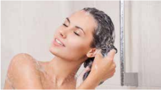
நியூயோர்க், ஒக். 14

ஒப்பனை பொருட்கள், ஷாம்போ, பொம்மை ஆடைகள் தயாரிப்புக்கு பயன்படுத்தப்படும் தாலேட்ஸ் (phthalates) என்ற இரசாயனத்தால் அமெரிக்காவில் மட்டும் ஆண்டுதோறும் ஒரு இலட்சம் பேர் உயிரிழக்கின்றனர் என்று நியூயோர்க் பல்கலைக்கழகத்தின் ஆய்வில் தெரிய வந்துள்ளது.