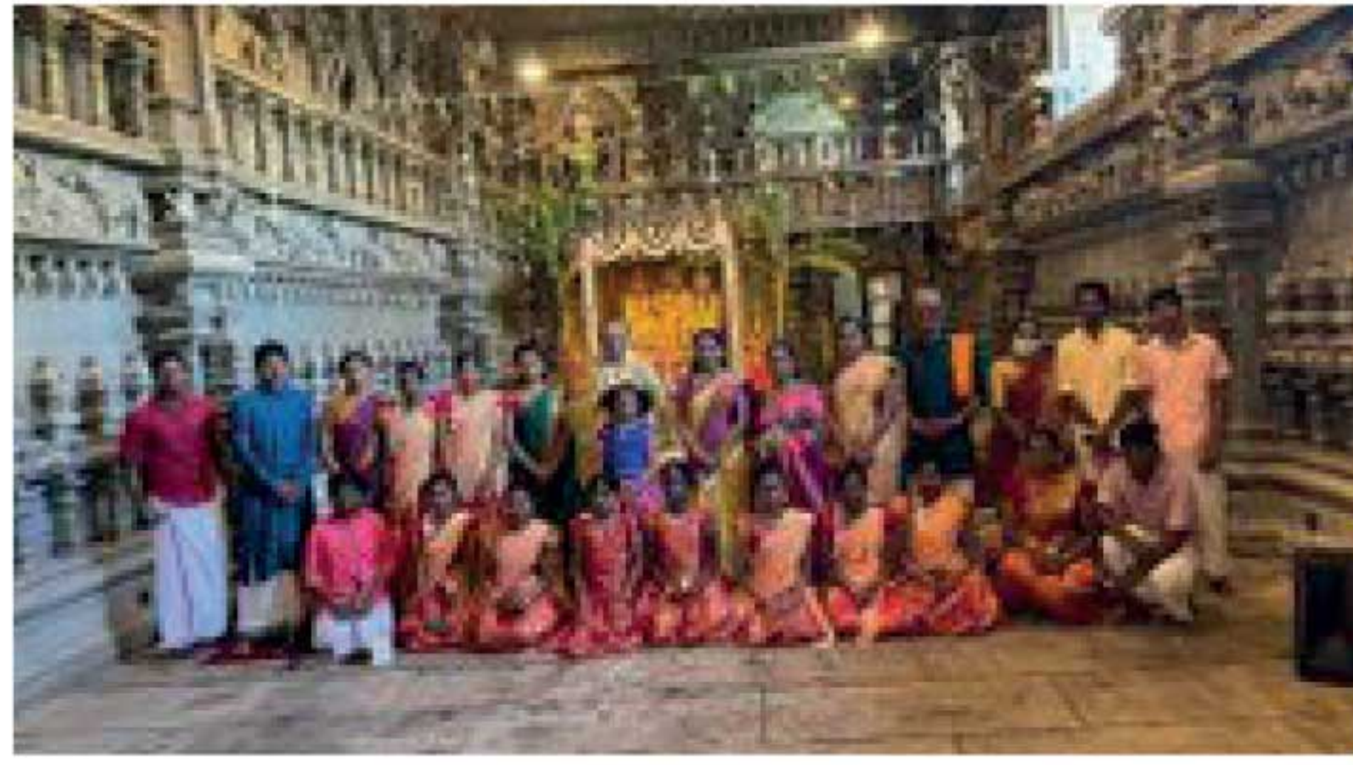
இலங்கைக்கு விஜயம் செய்திருக்கும் பாரதிய ஜனதா கட்சியின் சிரேஷ்ட தலைவரும், முன்னாள் அமைச்சருமான சுப்ரமணியன்சுவாமி, மயூரபதி ஸ்ரீ பத்ரகாளி அம்மன் கோவிலுக்கு நேற்று (13) சென்று வழிபாடுகளில் ஈடுபட்டார்.