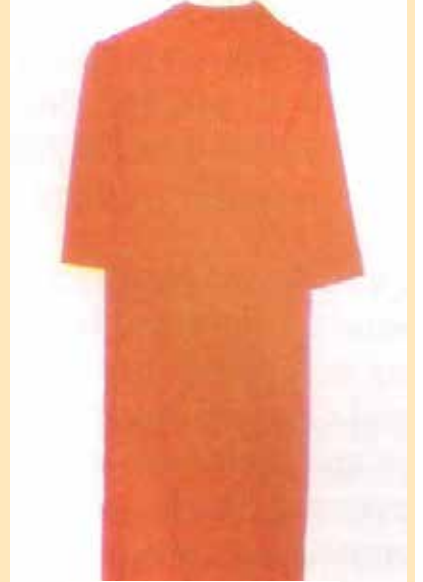
பாபா அருளிய அங்கி

ஒரு தடவை புட்டபர்த்தி யாத்திரை சென்றிருந்தபோது, பகவான் பாபா நேர் காணலுக்கு என்னையும், என் கணவரையும் அழைத்து, கணவரிடம் ஒரு நெக்லஸைக் கொடுத்து, என் கழுத்தில் அணியுமாறு கூறினார். அவ்வாறு அவரணியும்போது, சுவாமி எந்தலையில் தன் கை வைத்து ஏதோ மந்திரங்களைச் சொன்னார். அவர் திருப்பாதங்களில் வீழ்ந்து வணங்கினோம். அது ஆன்மிக