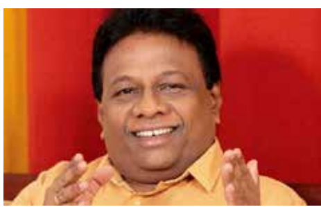
வருகின்றன எனத் தெரிவித்துள்ள அமைச்சர் உதய கம்மன்பில இறுதி முடிவு இன்னும் எட்டப்பட வில்லை என்றும் குறிப்பிட்டார்.

ஒரு லீற்றர் பெற்றோரின் விலையை 15 ரூபாவாகவும் ஒரு லீற்றர் டீசலின் விலையை 25 ரூபாவாகவும் அதிகரிக்க இலங்கை பெற்றோலியக் கூட்டுத்தாபனம் கோரிக்கை முன்வைத்துள்ளதாகக் கூறினார். இந்தக் கோரிக்கைகள் பரிசீலிக்கப்பட்டு