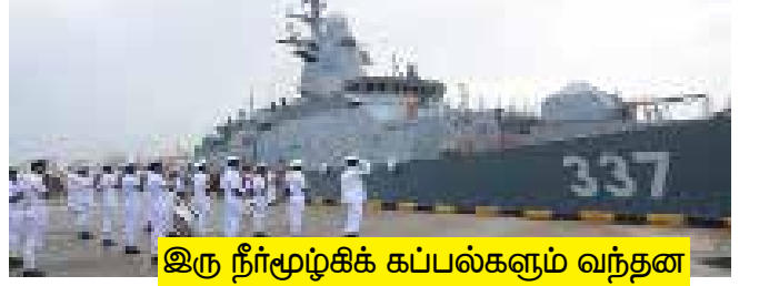
இரு நீர்மூழ்கிக் கப்பல்களும் வந்தன

ரஷ்ய நாட்டு கடற்படைக்குச் சொந்தமான இரண்டு நீர்மூழ்கிக் கப்பல்களும், போர்க் கப்பல் ஒன்றும் கொழும்புத் துறைமுகத்தை வந்தடைந்துள்ளன.