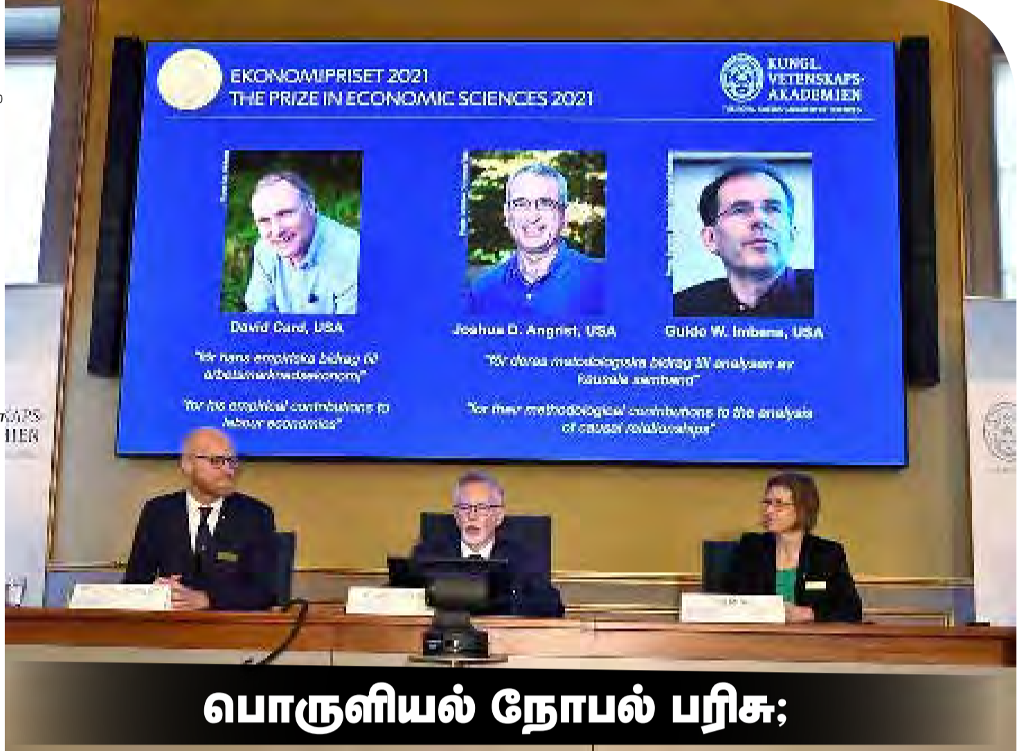
பொருளியல் நோபல் பரிசு;

தொழிலாளர்கள் புதிதாக வந்து குடியேறுவதால், பூர்வீகக் குடிகளின் வேலைவாய்ப்பில் உடனடியாக சவோ நீண்ட கால அளவிலோ எந்த மாற்றமும்