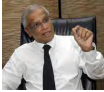
11ஆம் இலக்க சட்டத்தின் கீழ் தடைசெய்யப்பட்டுள்ளன. ஆனாலும், கடற்றொழில், நீரி

“எமது கடல் வளத்தையும் நீரியல் வளத்தையும் மிக மோசமாக அழிக்கும் இழுவைப் படகுகள், 2017ஆம் ஆண்டின்