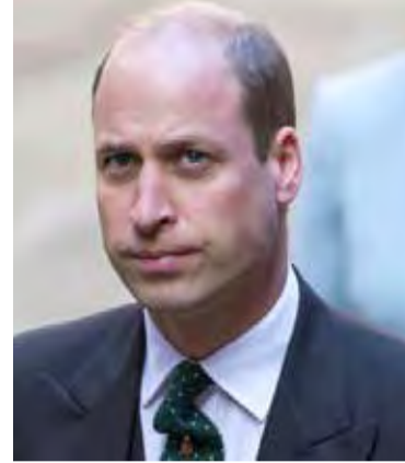
எலன் மாஸ்க் போன்றோர் வின் வெளிக்கு சுற்றுலா செலுத்தும் திட்டத்தை செயல்படுத்துவதில் தீவிரம்

லண்டன், ஒக்ட. 16 நாம் வாழ்வதற்கு ஏற்ற வகையில் பூமியை சரி செய்வதைத்தான் பார்க்க வேண்டுமே தவிர, வாழ்வதற்கு மற்றோர் இடத்தை தேடக் கூடாது என்று இங்கிலாந்து இளவரசர் வில்லியம்ஸ் தெரிவித்துள்ளார். காலநிலை மாற்றம் காரணமாக உலக நாடுகள் பெரும் பாதிப்பை எதிர்கொண்டு வருகின்றன. பூமி வெப்பமடைவது தொடர்ந்தால், 2050ஆம் ஆண்டுக்குள் மிகப் பெரும் பேராபத்தை உலக நாடுகள் எதிர்கொள்ளக்கூடும் என்று விஞ்ஞானிகள் எச்சரித்துள்ளன. இந்தநிலையில் உலகின் பெரும் பணக்காரர்களான ஜெப் பேசான்,