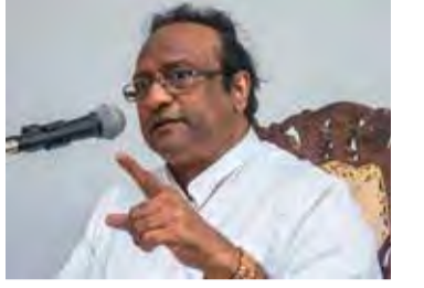
அச்சுறுத்தல் விடுத்தால் கடும் நடவடிக்கை எடுக்கப்படும்” - என்றார். (இ)

“பயங்கரவாதம் உருவாதற்கு வழிவகுத்த காரணி சரியாக இருக்கலாம். அவ்வாறு இல்லாவிட்டால் தவறாக இருக்கலாம். எனினும், அந்தவொரு காரணத்துக்காகவும் பயங்கரவாதத்தை நியாயப்படுத்த முடியாது. ஏனெனில் அதன்மூலம் மக்களே பாதிக்கப்படுவார்கள். அதேபோல் ஆசிரியர்களின் பிரச்சனை நியாயமானதாக இருக்கலாம். அதற்காக தொழிற்சங்க நடவடிக்கையை அனுமதிக்க முடியாது. இதனால் மாணவர்களே பாதிக்கப்படுகின்றனர். எனவே, பாடசாலைகளுக்குச் சமூகமளித்து, கல்வி நடவடிக்கையை ஆரம்பிக்குமாறு ஆசிரியர்களைக் கேட்டுக்கொள்கின்றேன். அவ்வாறு வரவிரும்பும் ஆசிரியர்களுக்கு எவராவது