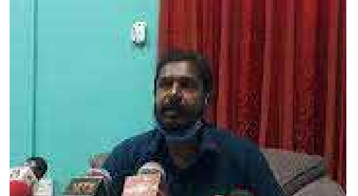
2 கோடி ரூபா நிதியில் நகரசபையின் மேற்பார்வையில் துரிதமாக இந்தப் பணிகள் முன்னெடுக்கப்படவுள்ளன எனவும் தவிசாளர் தெரிவித்துள்ளார்.

அந்தவகையில், முதற்கட்டமாக வவுனியா மணிக்கூண்டி கோபுர சந்தியில் இருந்து, பொது வைத்தியசாலை சுற்றுவட்டம் வரையான வீதிக்கரையில் அதனை அமைப்பதற்கான திட்டம் மேற்கொள்ளப்பட்டுள்ளது.