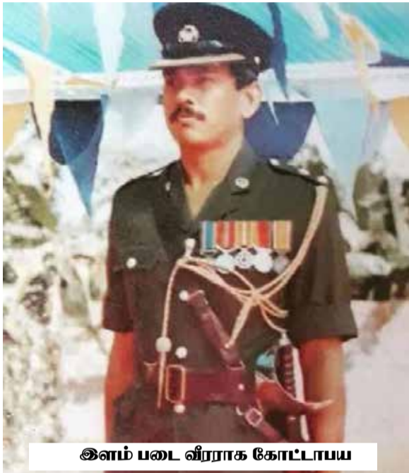
இளம் படை வீரராக கோட்டாபய

காலங்களில் பேசிய பேச்சுக்களுக்கும் அவரை பாதித்த ஒரு சம்பவம் உண்டு.