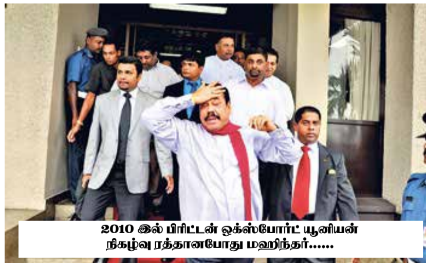
2010 இல் பிரிட்டன் ஓக்ஸ்போர்ட் யூனியன் நிகழ்வு ரத்தானபோது மஹிந்தா.....

தங்கள் செய்கிறார்கள். பிரச்சாரம் என்ற முறையில் அது பிரயோசனம் தரும். அதே சமயம் ஸ்ரீலங்கா அரசின் பிரதிநிதிகள் - கோட்டாவின் தனிப்பட்ட நண்பர்கள் - அரசாங்கத்துக்கு ஆதரவாக நாட்டில் செயற்படும் கட்சிகளின் அங்கத்தினர்கள் - ஏதோ ஒரு விதத்தில் அவருடன் சந்திப்புக்களை ஏற்படுத்தப் பணிகள் மேற்கொள்கிறார்கள். இதுவும் அரசாங்கம் ஏற்படுத்திக் கொள்ள விரும்பும் பிரச்சார யுத்தியே.