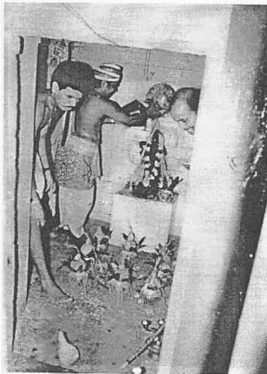
கண்ணகி அம்மனின் சும்பாபிஷேக திருக்காட்சி.