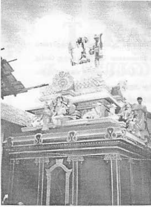
மூலஸ்தான தூபி அபிஷேக திருக்காட்சி.