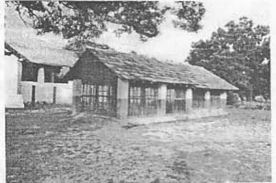
வைரவ சுவாமி கோயில் தோற்றம்.