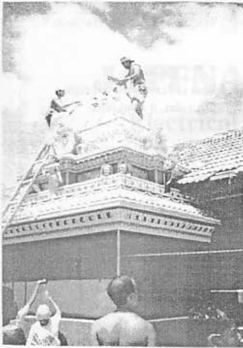
சுண்ணகி அம்மனின் தூபி அபிஷேக திருக்காட்சி.