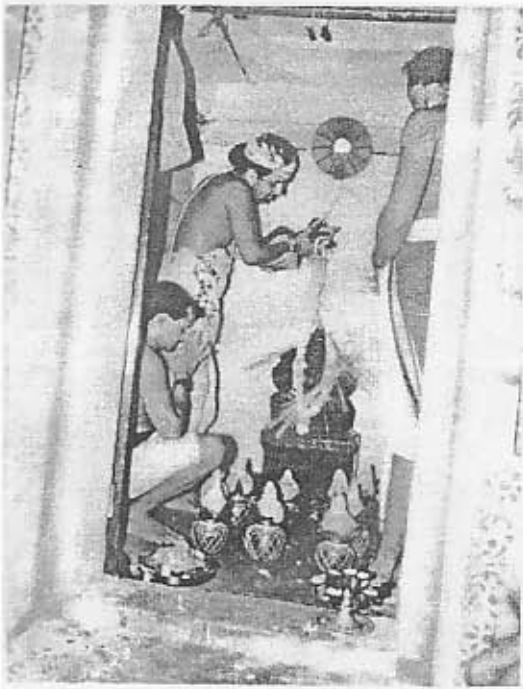
விநாயகப் பெருமானின் சும்பாபிஷேக திருக்காட்சி