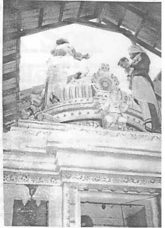
பிள்ளையார் தூபி அபிஷேக திருக்காட்சி.