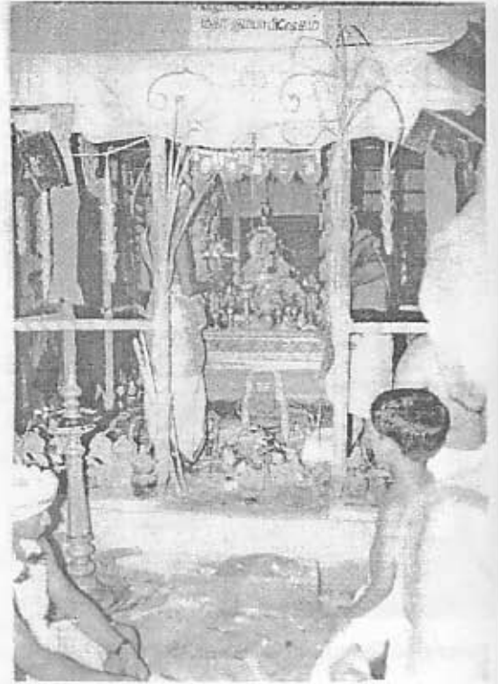
கும்பாபிஷேக யாக மண்டபம்.