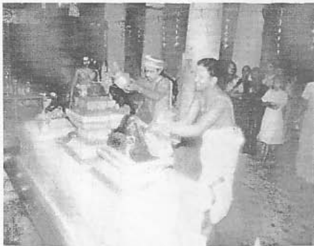
நந்தி பலிபீட கும்பாபிஷேக திருக்காட்சி