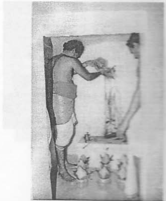
வைரவப் பெருமானின் சும்பாபிஷேக திருக்காட்சி.