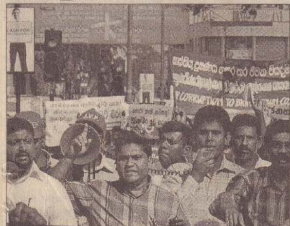
ஜே.வி.பி. தலைவர் சோமவன்ஸ அமரசிங்க தலைமையில் இந்த ஆர்ப்பாட்டப் பேரணி நடைபெற்றது. பேரணியின் தொடக்கத்தில் உரையாற்றிய சோமவன்ஸ அமரசிங்க தெரிவித்தவை வருமாறு:-

அரசுக்கு எதிராக ஜே.வி.பி யினர் நேற்று கொழும்பில் பாரிய ஆர்ப்பாட்டத்தை நடத்தினர்.