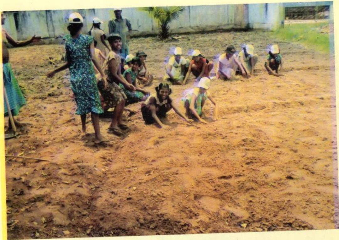
மட்டக்களப்பு சித்தாண்டி யோகர் சுவாமி இல்லத்தில் நடைபெற்ற வீட்டுத் தோட்டம் உருவாக்குதல் நிகழ்ச்சியிற் பங்குகொண்ட அறநெறிப்பாடசாலை மாணவர்கள்