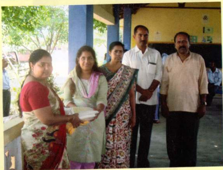
புத்தளம் மாவட்ட அறநெறிப் பாடசாலை மாணவர்களுக்குச் சீருடை வழங்கல்.