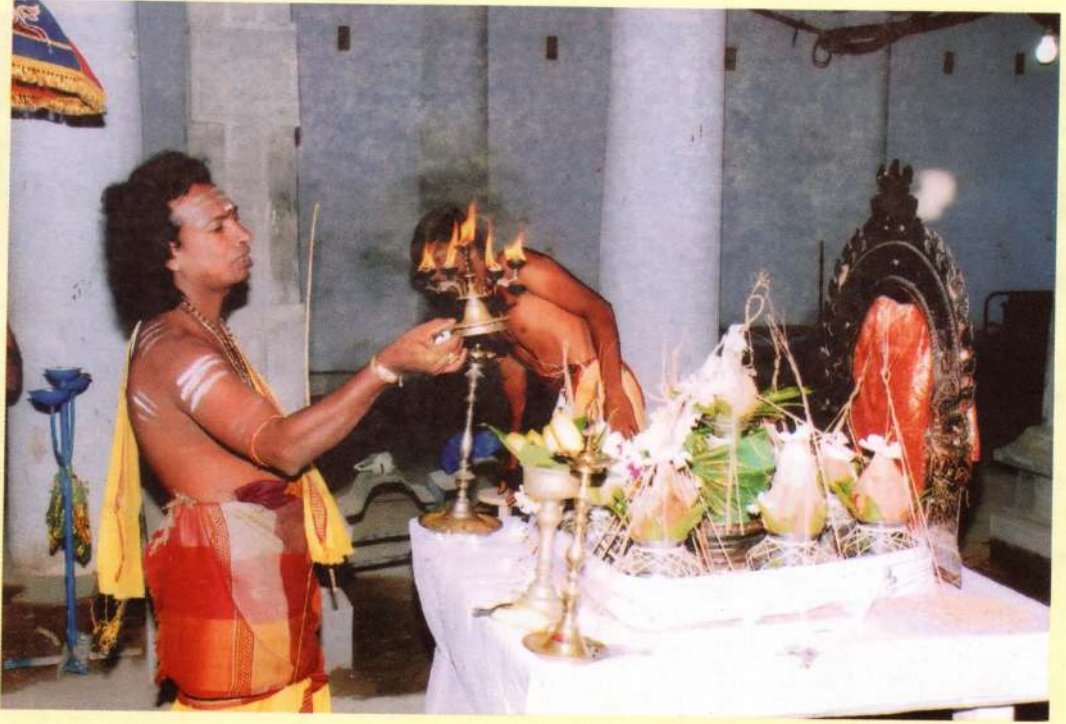
யாழ்ப்பாணம் வதிரி உல்லியனொல்லை கண்ணகை அம்மன் ஆலயத்தில் 01-06-2011 அன்று நடைபெற்ற ஆத்ம சாந்திப் பூசை நிகழ்வு