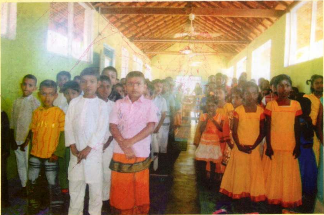
காரைக்காலம்மையார் பூஜையில் கலந்து கொண்ட அறநெறிப்பாடசாலை மாணவர்கள்