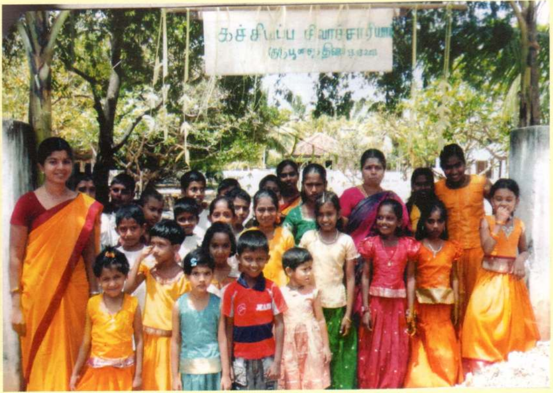
கல்லடி முத்துமாரியம்மன் அறநெறிப் பாடசாலையில் நடைபெற்ற கச்சியப்ப சிவாச்சாரியார் குருபூசை.