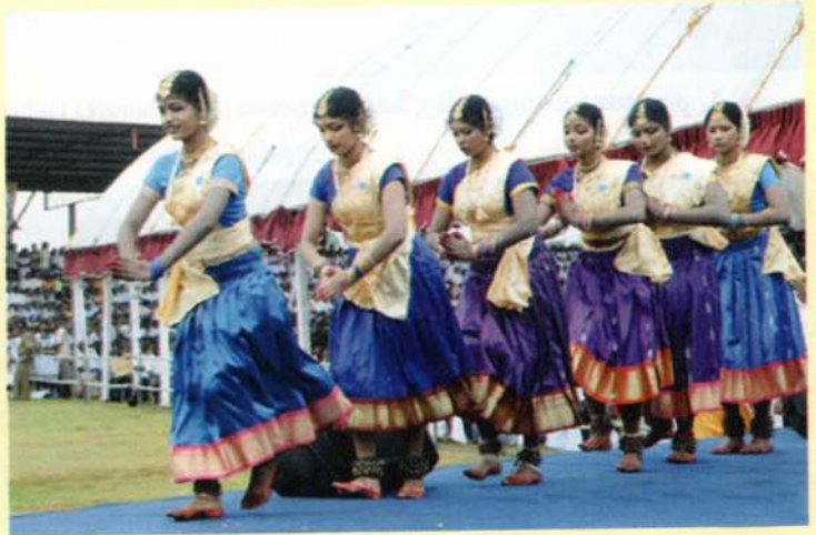
தைப்பொங்கல் விழாவில் இடம்பெற்ற கலை நிகழ்ச்சிகள்.