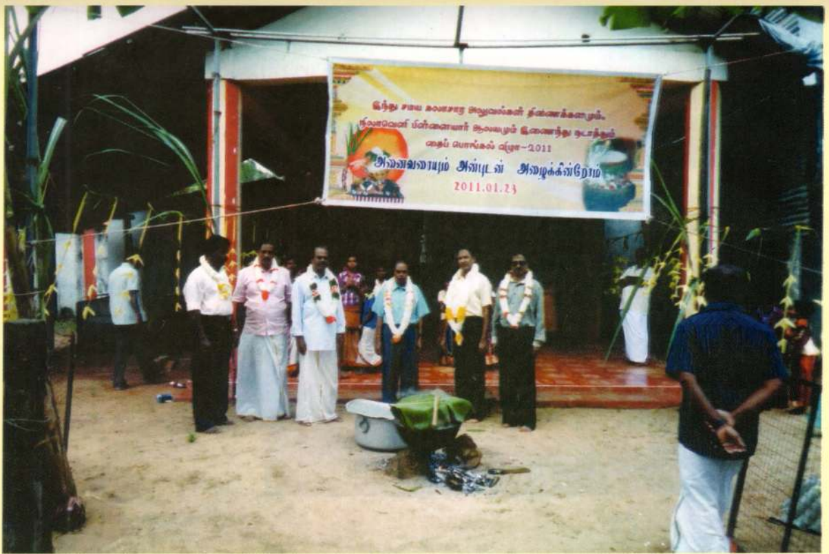
திணைக்களமும் திருகோணமலை நிலாவெளிப் பிள்ளையார் ஆலயமும் இணைந்து நடாத்திய தைப்பொங்கல் விழா