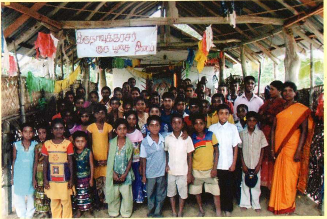
கணேசபுரம் விக்னேஸ்வரா அறநெறிப்பாடசாலையில் நடைபெற்ற திருநாவுக்கரசு நாயனார் குருபூசை நிகழ்வு