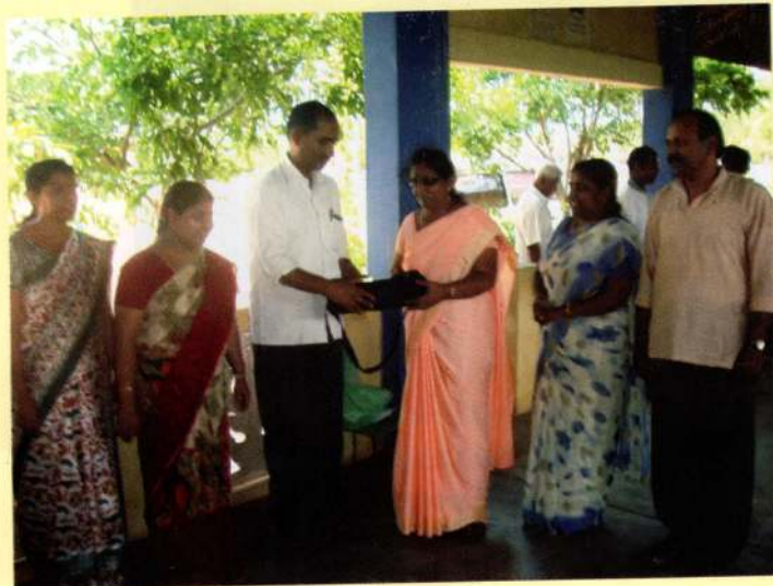
புத்தளம் மாவட்ட அறநெறிப் பாடசாலைகளுக்கு இசைக் கருவிகள் (சுருதி, தாளம்) வழங்குதல்.