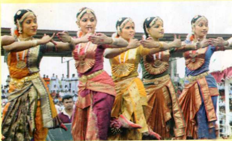
தைப்பொங்கல் விழாவில் இடம்பெற்ற கலை நிகழ்ச்சிகள்.