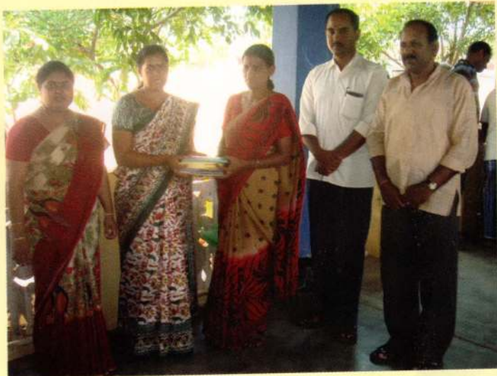
புத்தளம் மாவட்ட அறநெறிப் பாடசாலை ஆசிரியர் மாணவர்க்கான நூல்கள் வழங்குதல்