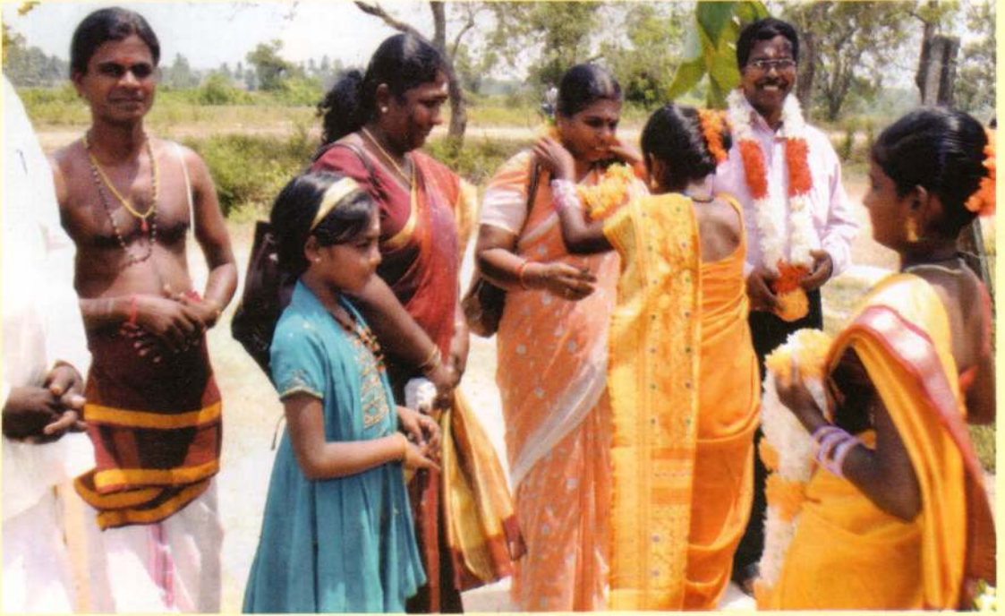
மட்டக்களப்பு மாவட்டம் மண்டூர், சங்கரபுரத்தில் நடைபெற்ற புண்ணிய கிராம நிகழ்ச்சி