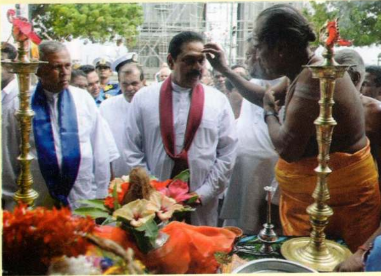
அதிமேதகு ஜனாதிபதி அவர்கள் கலந்து சிறப்பித்த யாழ்ப்பாண தைப்பொங்கல் விழா