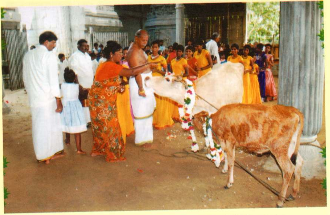
யாழ்ப்பாணம் மானிப்பாய் மருதடிப் பிள்ளையார் ஆயைத்தில் இடம் பெற்ற புண்ணிய கிராமம் நிகழ்ச்சி