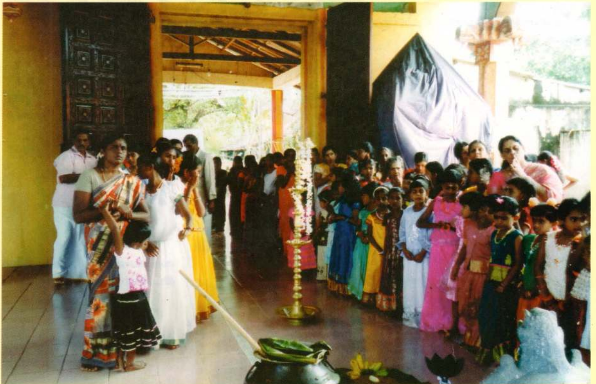
தைப்பொங்கல் விழாவை முன்னிட்டு பிள்ளையார் ஆலயத்தில் நடைபெற்ற பூஜையில் கலந்து கொண்டோர்