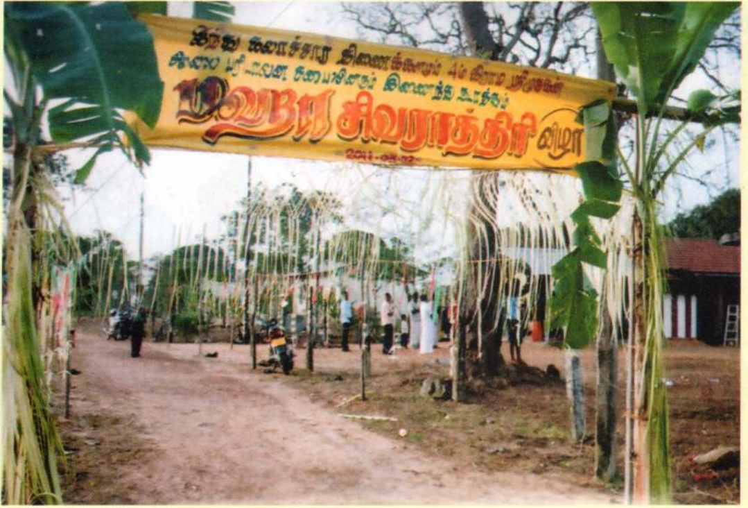
அம்பாறை மத்திய முகாம் ஸ்ரீ முருகன் ஆலயத்தில் இடம் பெற்ற சிவராத்திரி விழா