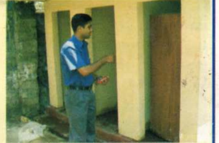
எமது நிறுவனத்தினால் சிறைச்சாலையில் அமைக்கப்பட்ட மலசலகூடங்களை பதில் மாவட்ட அலுவலர் பார்வையிடும் போது