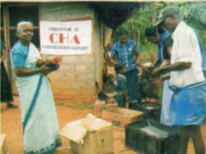
மனித உரிமை மீறல் சம்பவங்களினால் பாதிக்கப்பட்ட குடும்பங்களுக்கான வாழ்வாதார உதவித்திட்டம் (கோழி வளர்ப்பு)