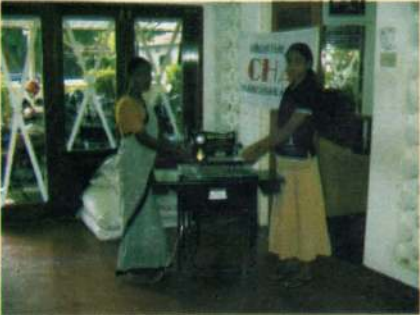
மனித உரிமை மீறல் சம்பவங்களினால் பாதிக்கப்பட்ட குடும்பங்களுக்கான வாழ்வாதார உதவித்திட்டம் (தையல் இயந்திரம்)