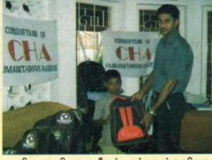
மனித உரிமை மீறல் சம்பவங்களினால் பாதிக்கப்பட்டவர்களின் பிள்ளைகளுக்கு பாடசாலை உபகரணம் வழங்கல்