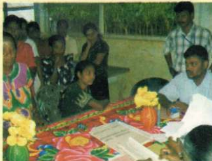
மாசி மாதத்திற்கான நடமாடும் இலவச சட்ட சேவை