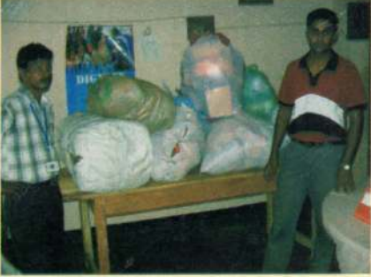
சரணடைந்தோருக்கான அத்தியாவசியப் பொருட்கள் வழங்கல்