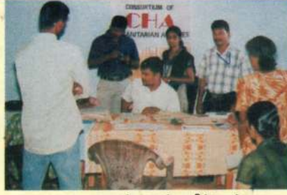
தை மாதம் சண்டிலிப்பாய் புலவர் முகாமில் இடம் பெற்ற இலவச நடமாடும் சட்டசேவை