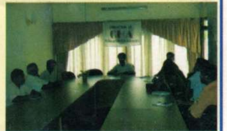
வாழ்வாதாரத்தை கட்டியெழுப்பல் தொடர்பான மாதாந்த கூட்டம்