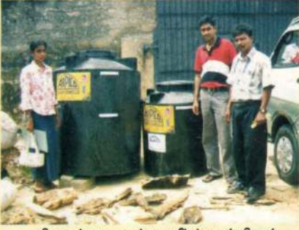
சிறைச்சாலைக்கு நீர்த்தாங்கிகள் கையளித்தபோது