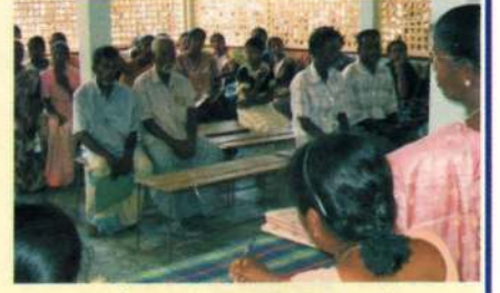
பங்குனி மாதம் சங்கானை ஓடக்கரை முகாமில் நடைபெற்ற நடமாடும் சேவையில் பயன்பெற்ற மக்களில் ஒரு பகுதியினர்.