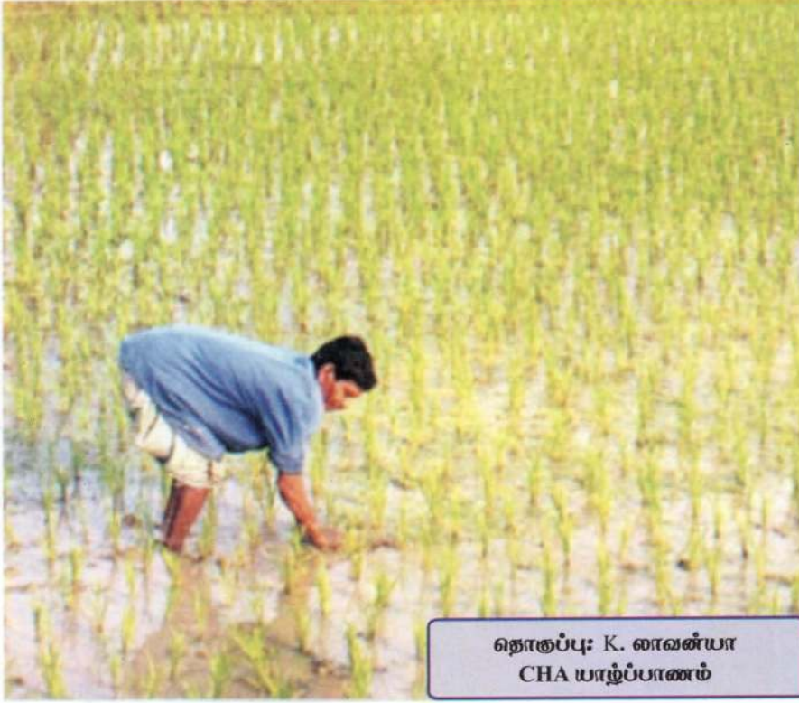
தொகுப்பு: K. லாவன்யா CHA யாழ்ப்பாணம்