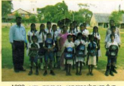
1000 பாடசாலை மாணவர்களுக்கு பாடசாலை உபகரணம் எமது நிறுவனத் தினால் வழங்கப்பட்டது. பயனடைந்த மாணவர்களில் ஒரு பகுதியினர்