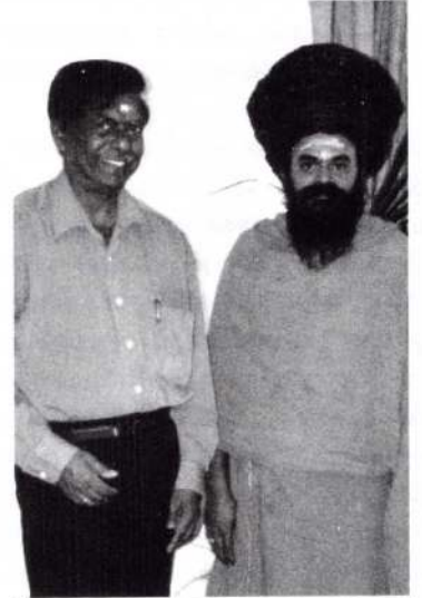
ஐ.தி சம்பந்ததுடன் சுவாமிகள்

என்னுடைய சமயம், என்னுடைய சமயம் என்று ஒவ்வொருவரும் பேணியதனால்தான் ஒரு மாற்றுச் சமயத்தினர், மாற்று மொழியினர், ஒரு மாற்று இனத்தவர் - அது மட்டுமல்ல நாஸ்திகர்கள் இருக்கும் இடங்களில் எல்லாம் எமது சமயத்தைக் கொண்டுசென்று வேருன்றச் செய்திருக்கிறார்களே அது வரலாற்று முக்கியத்துவம் வாய்ந்த செயல் அல்லவா?.