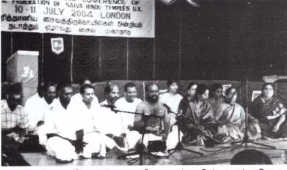
ஒதுவார் சாமி தண்டபாணி அவர்களின் பண்ணிசை