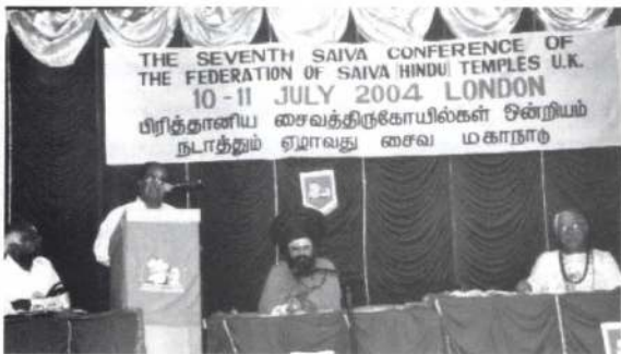
வைத்திய கலாநிதி நவரட்னம் உரை