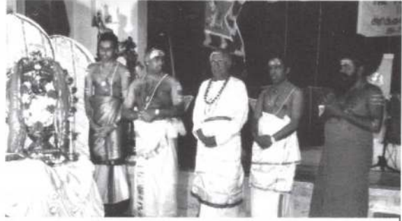
ஆரம்ப பூசை வழிபாடு