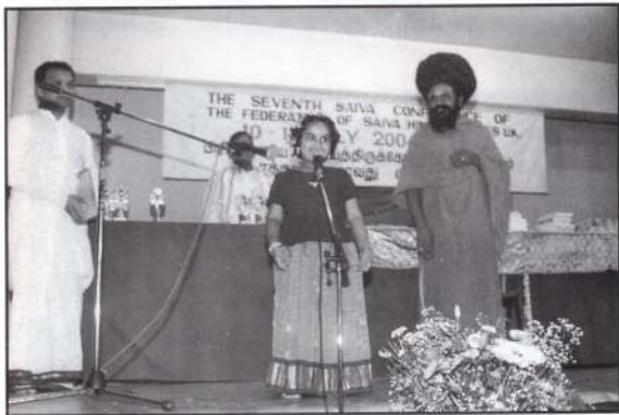
சிறுவர் விவாத அரங்குள்