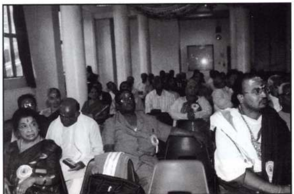
பார்வையாளர் ஒரு பகுதி