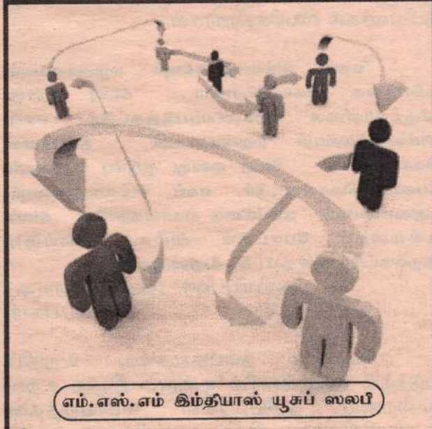
எம்.எஸ்.எம் கிம்தியாஸ் யூசுப் ஸலபி

இரத்த பந்தத்தை அறியியில் “ரஹிம்” என கூறப்படும். “ரஹிம்” என்பது அளவிலா அருளாளனாகிய (ரஹ் மானி)டமிருந்து வந்தவை (அருட்கொடை)யாகும்.