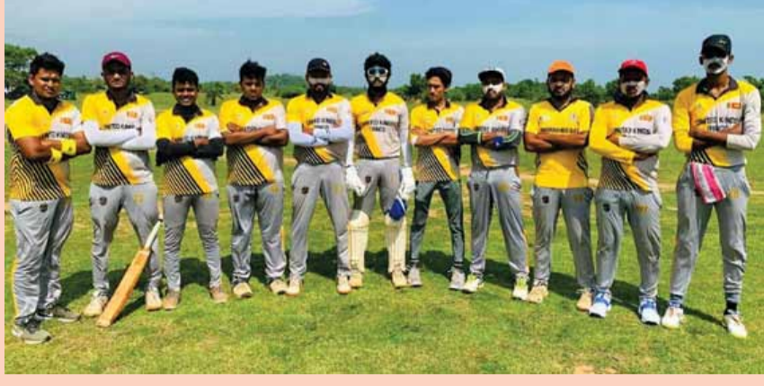
(திருகோணமலை ரவீக் பாயில்)

பாரதி விளையாட்டு கழக அணிக்கு எதிரான போட்டியில் யுனைடெட் கிங்ஸ் அணி 5 விக்ரெட்டுகளால் வெற்றிபெற்றுள்ளது. இப்போட்டி பாரதி விளையாட்டு கழக மைதானத்தில் நடைபெற்றது. நான்கு மணிக்குள் வெற்றிபெற்ற பாரதி விளையாட்டு கழக அணி முதலில் துடுப்பாட்ட தீர்மானித்து டிலான் 32 பந்துகளில் 35 ஓட்டங்களை பெற்றதுடன் இரண்டு விக்ரெட்டுகளையும் கைப்