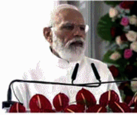
நிலையம் ரூ.260 கோடி செலவில் கட்டப்பட்டுள்ளது. புத்தர் முக்தி அடைந்த இடத்தைப் பார்வையிட

பெளத கொள்கையின் மையமாகத் திகழும் இந்தியாவில், இந்த விமான நிலையத்தை புத்தருக்காக ஆர்ப்பணிக்கிறோம். குவிநகர் விமான நிலையத்தை மேம்படுத்துவதற்கு, முக்கியத்துவம் அளித்தோம் என, குவிநகர் விமான நிலையத்தை திறந்து வைத்து உரையாற்றும்போது பிரதமர் நரேந்திர மோடி தெரிவித்தார். உத்தரப் பிரதேச மாநிலம் குவிநகர் சர்வதேச விமான