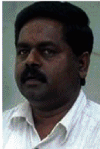
இடைப்பட்ட மாணவர்கள் என்றார். 17 தமிழ்ப் பெண்கள், குழந்தைகளுடன் சிறையில் இருக்கின்றனர்

புனர்வாழ்வு சட்டங்களை மாற்றுவதைப் பற்றி சபையில் பேசிக்கொண்டிருக்கின்றீர்கள். ஆனால், பலரின் கண் முன்னே, இராணுவத்திடம் ஒப்படைக்கப்பட்ட முன்னாள் போராளிகளின் பிள்ளைகளுக்கு நடந்தது என்னவென வினவிய தமிழ்த் தேசியக் கூட்டமைப்பின் பாராளுமன்ற உறுப்பினர் எஸ்.ஸ்ரீதரன், அவர்களின் பலர், தான் அதிபராக கடமையாற்றிய பாடசாலைகளில் கல்விப்பயின்ற, ஐந்து வயதுக்கும் 11 வயதுக்கும்