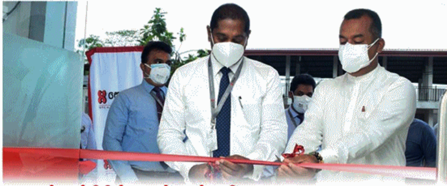
செலான் வங்கியின் ருவன்வெல்ல கிளை