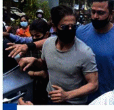
ஆர்யன் கானின் பிணை மனு தள்ளுபடி

இதேவேளை, கனமழையால் வீடுகளை இழந்தவர்களுக்கு அரசாங்கம் சார்பில் ரூ.1,09,000 மற்றும் பலியானவர்களின் குடும்பத்துக்கு நான்கு இலட்சம் ரூபாய் வீதம் வழங்கப்படும் என, உத்தரகண்ட் மாநில அரசாங்கம் அறிவித்திருந்தது. இந்திலையில் நேற்று (21), கனமழையின் தீவிரத்தை அறிய, மத்திய உள்துறை அமைச்சர் அமித்ஷா, உத்தரகண்ட் சென்று பார்வையிட்டுள்ளார்.