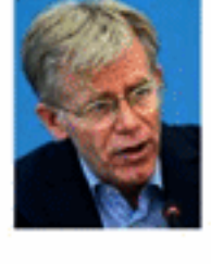
சர்வதேச செய்திகள் தெரிவிக்கின்றன. இவ்வாறு தடுப்பூசி தேவைப்படும் நாடுகளுக்கு 10 மில்லியனுக்கும் அதிக கொரோனா தடுப்பூசிகளை பிரித்தானியா வழங்கியுள்ளது.

ஏனைய நாடுகளுடன் ஒப்பிடுகையில், ஆபிரிக்க மக்கள் தொகையில் 5 சதவீதத்துக்கும் குறைவானவர்களே இதுவரை கொரோனா தடுப்பூசியை பெற்றுக் கொண்டுள்ளதாக