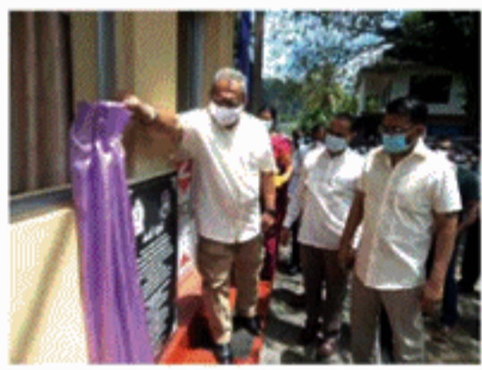
கோவை பிரதேச சபையில் 3 மில்லியன் ரூபாய் செலவில், தீவிர நகரில் கைமக்கப்பட்ட பூழி வாசிகளையெகளை கட்டும் மற்றும் சூழ்வேத சிகிச்சை மந்திரி நலையம் என்பவற்றை கிராமங்க கைமக்கர் தராக பாஸூரிய, சர்மலம மாகாண சூழூர் சூகியோர் திறந்து வைத்தனர். (என். சூராசி)