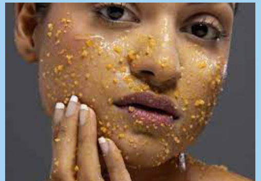
இந்த பற்று முகத்தை புத்துணர்ச்சியுடனும் வெளிக்காட்டும்.

எண்ணெய் பசைச் சருமம் உள்ளவர்கள், சந்தனப் பொடியை நீரில் கலந்து பசை செய்து, முகத்தில் தடவி பற்றுப் போட்டு வந்தால், சருமத்தின் நிறம் அதிகரிப்பதை நன்கு காணலாம்.