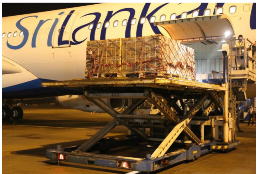
The first consignment of nano fertilizers from India arrived during early hours of 20th October 2021.