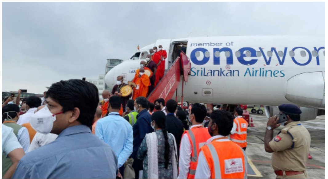
Kushinagar International Airport inaugurated by 95 Buddhist monks, SL Minister A total number of 111 passengers, including 95 Buddhist monks from Sri Lanka, landed at the newly-built Kushinagar International Airport, marking the first international flight to land at the airport.

Reaching the unreached: RTS,S increases equity in access to malaria prevention. Data from the pilot programme showed that more than two-thirds of children in the 3 countries who are not sleeping under a bednet are benefitting from the RTS,S vaccine. Layering the tools results in over 90% of children benefitting from at least one preventive intervention (insecticide treated bednets or the malaria vaccine).