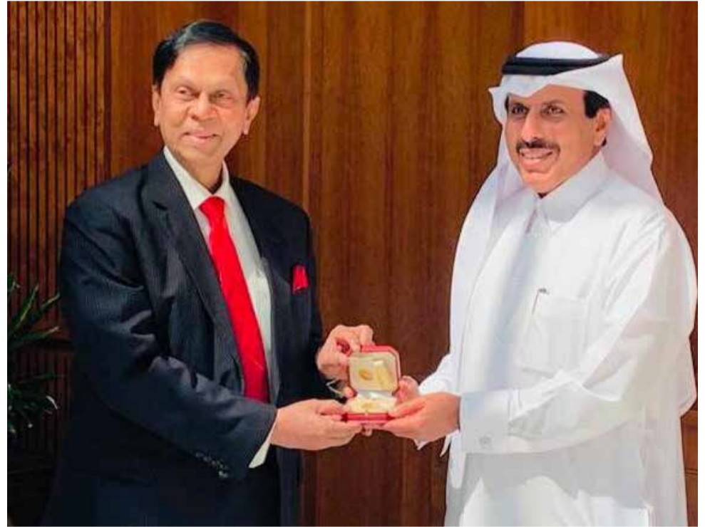
கொழும்பு, ஒக்ட. 24