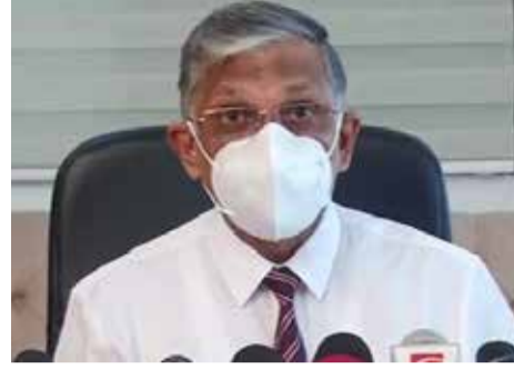
கொழும்பு, ஒக்ட. 24 ஆலயங்கள் உள்ளிட்ட அனைத்து மத வழிபாட்டுத் தலங்களில் ஒன்றுகூடக் கூடிய உச்ச எண்ணிக்கை 50 ஆக வரையறுக்கப்பட்டுள்ளது. வழிபாட்டுத் தலங்களில் ஈடுபடுவது

தொடர்பில் சுகாதார அமைச்சு வழிகாட்டல்களை வெளியிட்டுள்ளது.