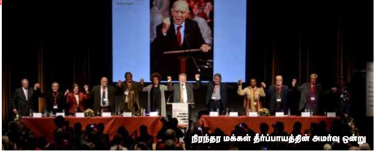
நிரந்தர மக்கள் தீர்ப்பாயத்தின் அமர்வு ஒன்று

சுகளிடையே பணிப்போர் நடந்து கொண்டிருந்தது. ஆகவே, அவை எல்லாம் இந்தப் பணிப்போரில் அகப்பட்டு சரி, பிழைகள் வல்லரசுகள் சார்பாகவே தீர்க்கப்பட்டன.